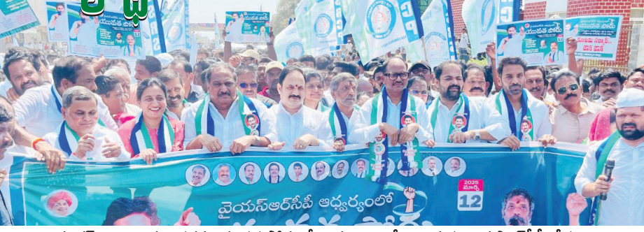
కలెక్టర్ కార్యాలయం వరకు యువత పోరులో భాగంగా ర్యాలీగా వెళ్తున్న వైయస్సార్సీపీ నేతలు