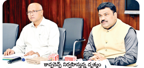
కాన్ఫరెన్స్ నిర్వహిస్తున్న దృశ్యం