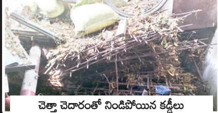
చెత్తా చెదారంతో నిండిపోయిన కడ్డీలు