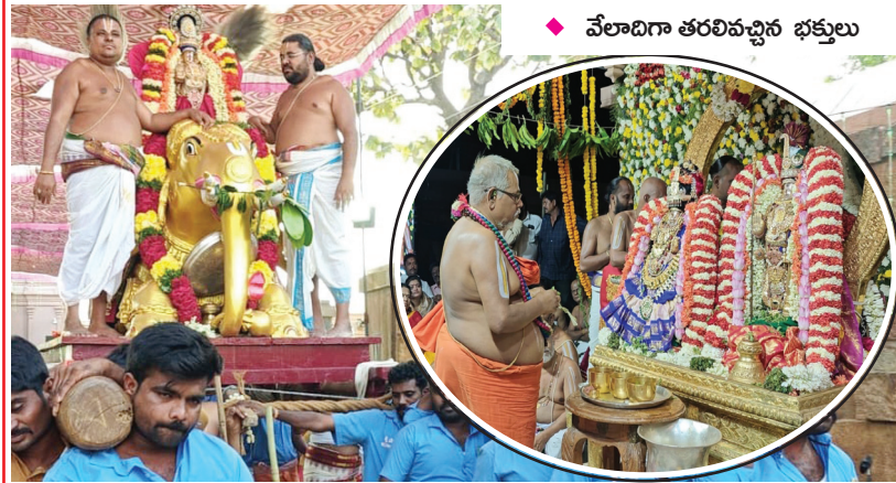
వేలాదిగా తరలివచ్చిన భక్తులు