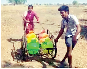
పంటపోలాల నుంచి త్రాగునీటిని తీసుకువస్తున్న అగ్రహారం గ్రామస్థులు