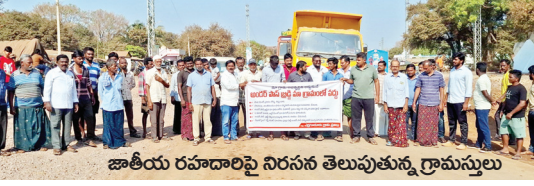
జాతీయ రహదారిపై నిరసన తెలుపుతున్న గ్రామస్థులు

పాములపాడు, మేజర్ న్యూస్ : పాములపాడు మండల పరిధిలోని ఎర్ర గూడూరు గ్రామంలో అండర్ పాస్ బ్రిడ్జి నిర్మాణం వద్దని గ్రామ స్థులు అందోళన చేపట్టారు కర్నూలు గుంటూరు జాతీయ రహదారి ఎర్రగూడూరు గ్రామం నుంచి వెళ్తుంది అయితే ఇంతకుముందు కొంతమంది అండర్ పాస్ కావాలని మరి కొంతమంది వద్దని