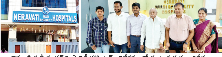
నెరవాటి మల్టీ సూపర్ స్పెషాలిటీ హాస్పిటల్, విలేఖరులతో మాట్లాడుతున్న అధినేతలు