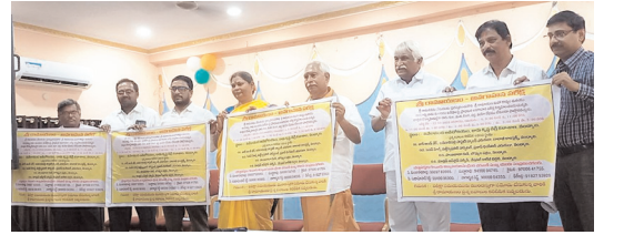
రామాయణ మహాకావ్యం బ్యానర్ ను అవిష్కరిస్తున్న దృశ్యం