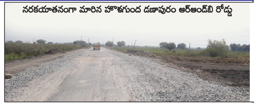
నరకయాతనంగా మారిన హెజాగుండ డ్రాఫ్టు అర్ అండ్ బి రోడ్డు