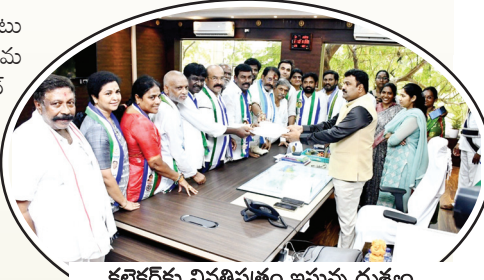
కలెక్టర్ కు వినతిపత్రం ఇస్తున్న దృశ్యం