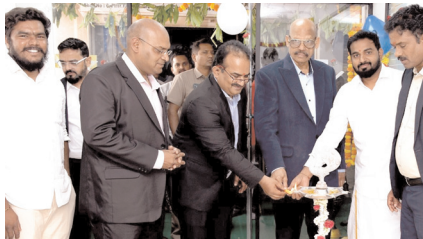
అభినందనీయమన్నారు. మన ప్రాంతంలో డిపాజిట్లు తక్కువగా, చెల్లింపులు ఎక్కువగా ఉంటాయని ఆయన

కర్నూలు సోఫ్ట్వే, మేజర్ న్యూస్ : హెచ్డీఎఫ్సీ బ్యాంకు వినియోగదారులకు అందిస్తున్న సేవలు అభినందనీయం మని మాజీ రాజ్యసభ సభ్యులు టీజీ వెంకటేష్ అన్నారు. బుధవారం స్థానిక కొత్త బస్టాండ్ దగ్గర హెచ్డీఎఫ్సీ బ్యాంకు నూతన బ్రాంచ్ను ఆయన ప్రారంభించారు. ఈ సందర్భంగా టీజీ వెంకటేష్ మాట్లాడుతూ హెచ్డీఎఫ్సీ బ్యాంకు స్థాపించిన అనంతకాలంలోనే బ్యాంకింగ్ రంగంలో విప్లవాత్మక మార్పులు తీసుకొచ్చి ప్రజల మన్ననలు పొందిందన్నారు. ప్రజలకు మెరుగైన సేవలు అందిస్తూ శాఖలను విస్తరించడం