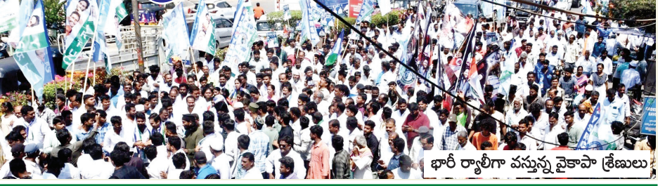
భారీ ర్యాలీగా వస్తున్న వైకాపా శ్రేణులు