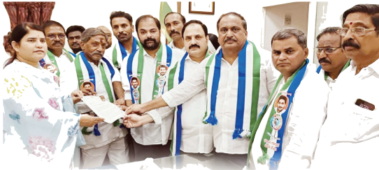
జిల్లా కలెక్టర్ రాజకుమారికి వినతిపత్రం అందజేస్తున్న వైయస్సార్సీపీ మాజీ ఎమ్మెల్యేలు