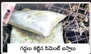
గడ్డలు కట్టిన సిమెంట్ బస్తాలు