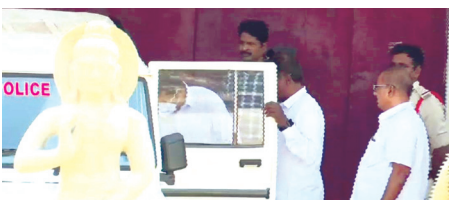
పోసానిని గుంటూరుకు తరలిస్తున్న దృశ్యం

కర్నూలు క్రిం, మేజర్ న్యూస్ : ప్రముఖ నటుడు, రచయిత, వైసిపి నేత పోసాని కృష్ణ మురళీకి కర్నూలు జిల్లా కోర్టు బెయిల్ ఇచ్చినా మరో కేసులో గుంటూరు సిబిడి పోలీసులు పిటి వారెంట్ వేసి కర్నూలు జైలు నుండి బుధవారం గుంటూరుకు తరలించారు. గత వారం రోజులుగా కర్నూలు జైలులో ఉంటూ వివిధ స్టేషన్లకు పిటి వారెంట్ల కింద తిరుగుతున్న పోసాని కృష్ణమురళీ విడుదలకు జైక్ పడింది. ఇక్కడి నుండి తీసుకెళ్లిన గుంటూరు సిబిడి పోలీసులు గుంటూరు జిల్లా కోర్టులో ప్రవేశపెట్టనున్నారు. పోసానిని సిబిడి పోలీసులు వర్చువల్ గా ప్రవేశపెట్టాలని ఆనుకున్నారు. అయితే ఫిజికల్ గా ప్రొడ్యూస్ చేయాలని కోర్టు చెప్పడంతో గుంటూరు సిబిడి అధికారుల సూచన మేరకు కర్నూలు సిబిడి పోలీసులు కర్నూలు జిల్లా జైలుకు వచ్చి బుధవారం మధ్యాహ్నం 3గంటల ప్రాంతంలో పోసానిని గుంటూరుకు తరలించారు.