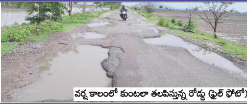
పద్మ కాలంలో కుంటలా తలపిస్తున్న రోడ్డు (ఫైర్ ఫోటో)