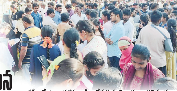
పరీక్షా కేంద్రాల వద్దకు భారీగా చేరుకున్న విద్యార్థులు, తల్లిదండ్రులు