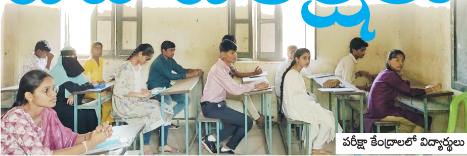
పరీక్షా కేంద్రాలలో విద్యార్థులు