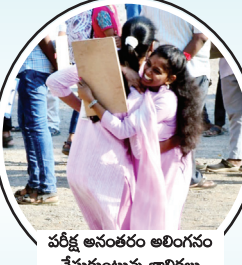
పరీక్ష అనంతరం అలింగనం చేసుకుంటున్న బాలికలు