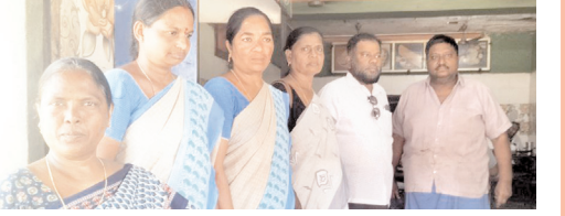
హోటల్ యజమానితో మాట్లాడుతున్న అధికారులు