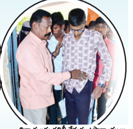
విద్యార్థులను తనిఖీ చేస్తున్న ఉపాధ్యాయులు