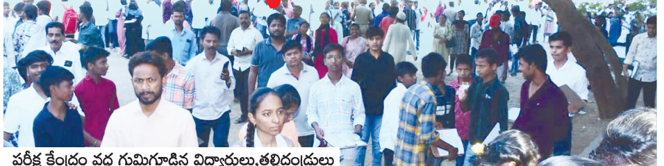
పరీక్షా కేంద్రం వద్ద గుమిగూడిన విద్యార్థులు, తల్లిదండ్రులు