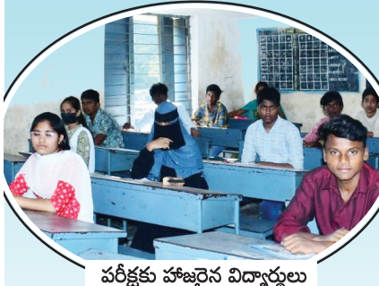
పరీక్షకు హాజరైన విద్యార్థులు