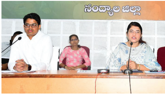
సమీక్ష సమావేశంలో మాట్లాడుతున్న కలెక్టర్ రాజకుమారి

నంద్యాల కల్చరల్, మేజర్ న్యూస్ : జిల్లాలోని అభివృద్ధి సంస్థల ఏర్పాటుకు ప్రభుత్వ స్థలాలను గుర్తించాలని జిల్లా కలెక్టర్ రాజకుమారి సంబంధిత అధికారులను ఆదేశించారు. సోమవారం కలెక్టరేట్ లోని పిజిఆర్ఎస్ హాలులో జిల్లా నలుమూలల నుంచి వచ్చిన ప్రజల నుంచి ఫిర్యాదుల స్వీకరణకు ముందుకు వివిధ అంశాలపై అధికారులతో సమీక్ష నిర్వహించారు. సమావేశంలో జాయింట్ కలెక్టర్ విష్ణుచరణ్, డిఆర్వో మిగతా 2లో |