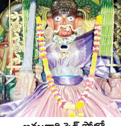
అమ్మవారి ఫైల్ ఫోటో

బనగానపల్లె, మేజర్ న్యూస్ : నందవరం శ్రీ చౌడేశ్వరి అమ్మవారి రాయబారాది జ్యోతి రథ వసంతోత్సవాలు ఈ నెల 30వ తేదీ నుండి ఏప్రిల్ 5వ తేదీ వరకు నిర్వహించడం జరుగుతుందని ఆలయ అసిస్టెంట్ కమీషనర్ కామేశ్వరమ్మ తెలిపారు. 30వ తేదీ ఆదివారంనాడు గణపతి పూజ పుణ్యహవాచనం అనంతరం అంకురార్చన పంచాంగశ్రవణం, పన్నెరపు బండ్లు తిప్పట, ప్రాకర రథోత్సవం కార్యక్రమాలు 31వ తేదీ సోమవారంనాడు శ్రీదేవి, భూదేవి సమేత చెన్నకేశవస్వామి కళ్యాణోత్సవం రాత్రి 10గంటలకు సాంస్కృతిక కార్యక్రమాలు ఏప్రిల్ 1వ తేదీన మంగళవారం అమ్మవారికి కుంకుమార్చన, సాయంకాలం అమ్మవారి రాయబారాది మహోత్సవం, రాత్రి 10గంటలకు పౌరాణిక నాటక ప్రదర్శన 2వ తేదీ బుధవారంనాడు అమ్మవారికి సహస్రనామ కుంకుమార్చన, పనుపుకుంకుమ, పట్టుపస్త్రాల అలంకరణ, సాయంత్రం అన్నపూర్ణ సంగీత కార్యక్రమాలు రాత్రి 12గంటల నుండి శ్రీ భాస్కరయ్య ఆచారీచే అమ్మవారికి దిష్టిమక్క పెట్టటం, శ్రీ చౌడేశ్వరీదేవి జ్యోతి మహోత్సవం, 3వ తేదీ గురువారం అమ్మవారి రథోత్సవం (పోవడం) 4వ తేదీ శుక్రవారంనాడు అమ్మవారి రథోత్సవం (రావడం) 5వ తేదీ శనివారంనాడు వసంతోత్సవ కార్యక్రమాలతో అమ్మవారి జ్యోతి మహోత్సవ వేడుకలు ముగుస్తాయని ఈ కార్యక్రమంలో భక్తులు పాల్గొని అమ్మవారి కృపకు పాత్రులు కావాలని ఆలయ ఈ.బి తెలిపారు.