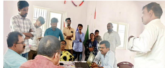
ప్రతేక సమావేశంలో మాట్లాడుతున్న జిల్లా అధికారులు