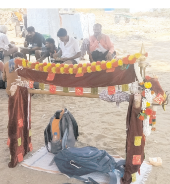
సారేతో విచ్చేసి సేద తీరుతున్న కన్నడీగులు

నందవరం, మేజర్ న్యూస్ : ఉగాధి పర్వదిన పురస్కరించుకుని కర్ణాటక ప్రాంతం వారు తమ ఆదర్శమైన అయిన శ్రీశైలం శక్తి పీఠం అయిన శ్రీ భ్రమరాంభికాదేవికి సారేతో కన్నడీగులు కాబిబాటన విచ్చేస్తున్నారు.. ప్రతి ఏటా వారు వారి పంట పొలాలు నుండి దాన్యం ఇల్లు చేరాక కాబిబాటన వేల కి.మీ సడకతో శ్రీశైలం చేరుకుంటారు. వారు దారిలో నందవరం చేరుకున్నారు. కర్ణాటక రాష్ట్రం బెల్గాం, బాగల్కోట, గుల్బర్గా, తదితర ప్రాంతాల నుండి పయణం చేస్తూ వస్తున్నారు. తొలి అడుగులు మన రాష్ట్రంలోని నందవరంకు కన్నడీగుల అడుగులు మంగళవారం చేరుకున్నాయి. వారు ఇలా వారం రోజులపాటు మండల కేంద్రం నందవరం చేరకుని అక్కడి నుండి కనకవీడు,