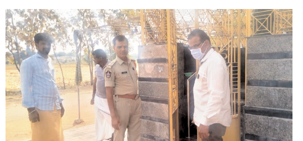
టోపి మారెమ్మ అవ్వ గుడి దగ్గర పరిశీలన చేస్తున్న ఎస్పి