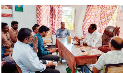
సమీక్షా సమావేశం నిర్వహిస్తున్న దృశ్యం