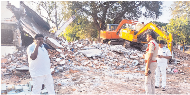
ఘటనా స్థలాన్ని పరిశీలిస్తున్న ఎస్సై, ఆలయ అధికారులు

■ ఇద్దరు మృతి ■ నాగనంది సదనం కూల్చుతుండగా ప్రమాదం