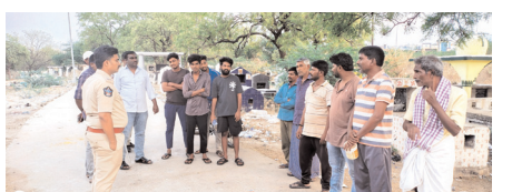
అవగాహన కల్పిస్తున్న పోలీసులు