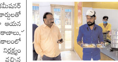
క్యాంటీన్ తనిఖీ చేస్తున్న కమీషనర్

కర్నూలు నగరం, మేజర్ న్యూస్ : నగరంలోని అన్నా క్యాంటీన్ లో ఆహార నాణ్యత ప్రమాణాలపై నగరపాలక కమీషనర్ యస్ రవీంద్రబాబు ప్రజలను ఆరాతీశారు. మంగళవారం పాత బస్ స్టేషన్ లో అన్నా క్యాంటీన్ ను కమీషనర్ ఆకస్మిక తనిఖీ చేశారు. అల్పాహారం చేయడానికి వచ్చిన ప్రజలను కమీషనర్ ఆహ్వానంగా పలకరించి అల్పాహార రుచిని అడిగి తెలుసుకున్నారు. క్యాంటీన్ వద్ద సమయం కన్నా ముందే స్వచ్ఛత పనులు చేపట్టాలని, ఆహార నాణ్యత విషయంలో రాజీ పడొద్దని కమీషనర్ నిర్వాహకులకు సూచించారు. తప్పనిసరిగా మేనూ పాటించాలన్నారు.