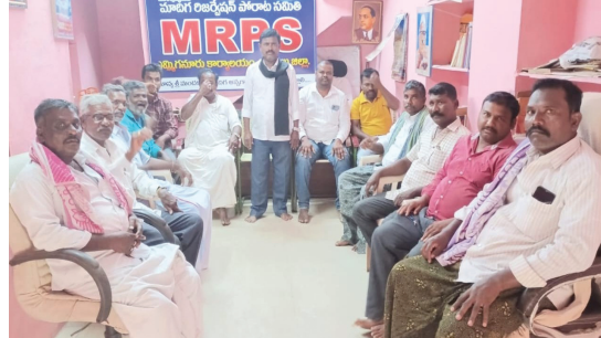
సమావేశంలో మాట్లాడుతున్న ఎమ్మార్సీఎస్ నాయకులు.

చంద్రబాబుకే దక్కుతుందన్నారు. తక్షణమే వర్గీకరణ ప్రక్రియను వేగవంతం చేయడంతో పాటు ఆంధ్రప్రదేశ్ రాష్ట్రంలో వర్గీకరణను అమలు చేసి ఎస్సీ 59 ఉప కులాలకు విద్యా, ఉద్యోగ అవకాశాలు కల్పించి సామాజిక న్యాయం జరిగేలా చూడాలని విజ్ఞప్తి చేశారు. చంద్రబాబుకు మాదిగలు ఎల్లవేళలా రుణపడి ఉంటారని చెప్పారు. వర్గీకరణ చేసేలా చొరవ చూపిన చంద్రబాబుకు ఈ సందర్భంగా వారు ధన్యవాదాలు తెలియజేశారు.