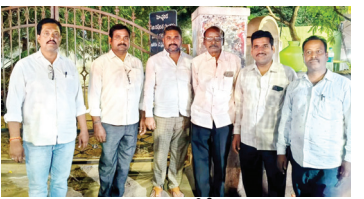
మాట్లాడుతున్న చేనేత టీడీపీ నాయకులు

నేతన్నల తరపున ప్రభుత్వానికి కృతజ్ఞతలు ఎమ్మిగనూరు టౌన్, మేజర్ న్యూస్ : చేనేత కార్మికుల అభ్యున్నతి కూటమి ప్రభుత్వం సీఎం చంద్రబాబు నాయుడుతోనే సాధ్యం అని, చేనేత కార్మికుల కోసం 200 యూనిట్ల ఉచిత విద్యుత్తును ప్రకటించడం ఎంతో సంతోషకరమని టీడీపీ చేనేత నాయకులు పేర్కొన్నారు. మంగళవారం వారు మాట్లాడుతూ కూటమి ప్రభుత్వం తీసుకున్న ఈ నిర్ణయంతో ఆర్థిక భారం తగ్గించడంతో పాటు, చేనేత రంగ అభివృద్ధికి చెందుతుందన్నారు. చేనేత కార్మిక సంఘాల ప్రతినిధులు