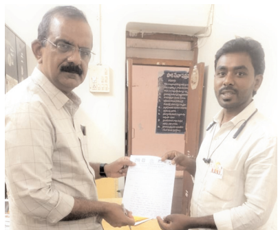
ఎన్ఈ కి విన్నవించుకుంటున్న విద్యార్థిసంఘం నాయకులు అమ్మకాలకు తీసుకెళ్లాలన్న రోడ్డు అద్దాస్తు దుస్థితి నేపథ్యంలో అప్లై చేయాలని పాలు అవుతున్నారన్నారు. ఇక ఎమ్మిగనూరు వైద్యశాలకు రావాలంటే