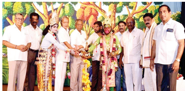
జ్యోతిప్రజ్ఞులను చేస్తున్న దృశ్యం