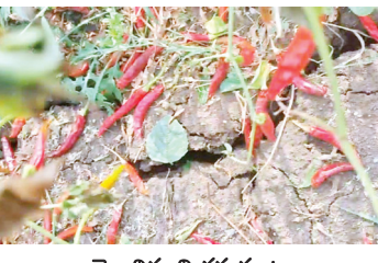
దెబ్బతిన్న మిరప పంట

కోవెలకుంట్ల, ప్యాపిలి, మేజర్ న్యూస్ : మండలంలో శనివారం కురిసిన అకాల వర్షంతో, రేవనూరు గ్రామంలో వడగండ్లతో కూడిన వర్షం కురవడంతో మిరప, పత్తి పంటలకు తీవ్ర నష్టం వాటిల్లినట్లు రైతులు తెలిపారు. మిరప పంట కొంత మేరకు కోత దశలో ఉండగా మరికొంత కోసిన పంట ఆరబెట్టగా ఈ అకాల వర్షాల వల్ల పంటలకు తీవ్ర నష్టం వాటిల్లిందని పత్తి పంట పూర్తిగా దెబ్బతిందని రైతులు ఆవేదన వ్యక్తం చేశారు. సాగు చేసినప్పటి నుంచి రైతులకు ఈ ఏడాది ప్రకృతి సహకరించకపోవడంతో కాస్తో కాస్తో వచ్చిన పంటలు సైతం అకాల వర్షం,