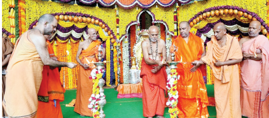
జ్యోతి ప్రజల్య చేసిన ప్రారంభిస్తున్న మఠం పీఠాధిపతి