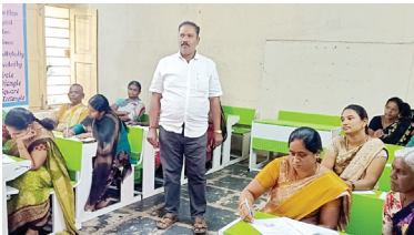
పరీక్షలు వ్రాస్తున్న వయోజనులు