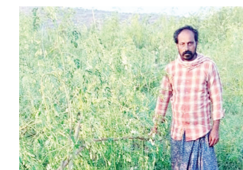
నేలకొరిగిన మునగ పంటను చూపిస్తున్న రైతు

కోవెలకుంట్ల, ప్యాపిలి, మేజర్ న్యూస్ : మండలంలో శనివారం కురిసిన అకాల వర్షంతో, రేవనూరు గ్రామంలో వడగండ్లతో కూడిన వర్షం కురవడంతో మిరప, పత్తి పంటలకు తీవ్ర నష్టం వాటిల్లినట్లు రైతులు తెలిపారు. మిరప పంట కొంత మేరకు కోత దశలో ఉండగా మరికొంత కోసిన పంట ఆరబెట్టగా ఈ అకాల వర్షాల వల్ల పంటలకు తీవ్ర నష్టం వాటిల్లిందని పత్తి పంట పూర్తిగా దెబ్బతిందని రైతులు ఆవేదన వ్యక్తం చేశారు. సాగు చేసినప్పటి నుంచి రైతులకు ఈ ఏడాది ప్రకృతి సహకరించకపోవడంతో కాస్తో కాస్తో వచ్చిన పంటలు సైతం అకాల వర్షం,