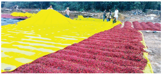
మిరప పంటను ఆరబెట్టకుంటున్న రైతులు

ఉయ్యాలవాడ, మేజర్ న్యూస్ : మండలంలో శనివారం సాయంత్రం కురిసిన అకాల వర్షానికి మిరప రైతులు అవస్థలు పడ్డారు. ఏ గ్రామంలో చూసినా మిరప, మొక్కజొన్న, పొగాకు పంట ఉత్పత్తులను కలాల్లో ఆరబెట్టుకున్నారు. ఈ అకాల వర్షానికి పంట దిగుబడులు తడిచిపోకుండా కాపాడుకోవడానికి నానా అవస్థలు పడ్డారు. ఆదివారం ఉదయం పంట దిగుబడులపై కమ్మి ఉంచిన ప్లాస్టిక్ పట్టలను తొలగించి ఆరబెట్టుకున్నారు. ఈ వర్షం వేసవి నుంచి ఉపశమనం కల్పించినప్పటికీ రైతులకు మాత్రం ఇబ్బందులు కల్పించింది.