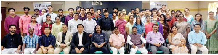
వైద్యులకు అవగాహన కల్పిస్తున్న దృశ్యం

కర్నూలు క్రిం, మేజర్ న్యూస్ : చిన్న పిల్లల్లో ఒక్కోసారి అత్యవసర పరిస్థితులు ఏర్పడతాయిని వాటిని సమర్థంగా ఎదుర్కోవాలంటే ఆత్మాధునిక చికిత్సలు చేయాల్సి ఉంటుందని సీనియర్ వైద్య నిపుణులు తెలిపారు. పిల్లల్లో ఎక్స్, సిఆర్ఆర్టీ (కంటిన్యూవ్ రీనల్ రిప్లేస్ మెంట్ థెరపీ) లాంటి చికిత్సలు చేయాల్సి వచ్చినప్పుడు తీసుకోవాల్సిన జాగ్రత్తలు, పాటించాల్సిన విధివిధానాలపై రాయలసీమ వ్యాప్తంగా ఉన్న పలువురు చిన్న పిల్లల వైద్య నిపుణుల కోసం కర్నూలు కిమ్స్ ఆసుపత్రి, ఇండియన్ ఆసోసియేషన్ ఆఫ్ పీడియాట్రిషియన్స్ (ఐపిపి) ఆధ్వర్యంలో ఆదివారం ఒక కంటిన్యూవ్ మెడికల్ ఎడ్యుకేషన్ (సిఎంఈ) వర్క్ షాప్ నిర్వహించారు. ఎక్స్ట్రా కార్పొరేయల్ థెరపీస్ అంటే ఎక్స్, సిఆర్ఆర్టీ ఇంకా పలు రకాల చికిత్స విధానాలపై అక్కడకు వచ్చిన చిన్నపిల్లల వైద్యులందరికీ సమగ్రంగా వివరించారు. దాంతో పాటు ఆత్మాధునిక పరికరాలు కూడా