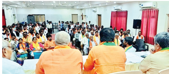
హాజరైన మండల అధ్యక్ష కార్యర్థులు

(మొదటిపేజి తరువాయి..) అన్ని రాష్ట్రాల్లో నేతలు, ముఖ్య నాయకులు బీజేపీ వైపు చూస్తున్నారన్నారు. బీజేపీ నాయకులకు, కార్యకర్తలకు పార్టీ ఎల్లప్పుడూ అండగా ఉంటుందన్నారు. జిల్లాలో పార్టీని క్షేత్ర స్థాయిలో తీసుకొని వెళ్లాలని బాధ్యత ప్రతి కార్యకర్తపై ఉందన్నారు. జిల్లాలో పార్టీ బలపేతం దిశగా వేగంగా పావులు కదపాలని అవసరం ఎంతైనా ఉందన్నారు. రాష్ట్ర వ్యాప్తంగా 222 మార్కెట్ యార్డు కమిటీలతో పాటు కమిటీ చైర్మన్లు,