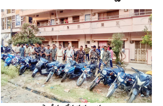
స్వాధీనం చేసుకున్న వాహనాలు