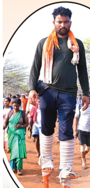
కర్రల సహాయంతో నడుస్తున్న కన్నడభక్తుడు

ఆత్మకూరు, మేజర్ న్యూస్: మమ్మును ఆదుకోవా... మల్లయ్య, చేరుకుంటా... మల్లయ్య అంటూ శ్రీశైలం మల్లన్నను అడుగడుగునా నా న్యరిస్తు కన్నడ, మహారాష్ట్ర భక్తులు పాదయాత్రగా వెళ్తున్నారు. శ్రీశైల ప్రమాంబిక దేవిని తమ ఇంటి ఆడపడమగా, శ్రీమల్లికార్జున స్వామి వాళ్లను అల్లుడిగా భావించి కన్నడీగులు ఉగాది పర్వది