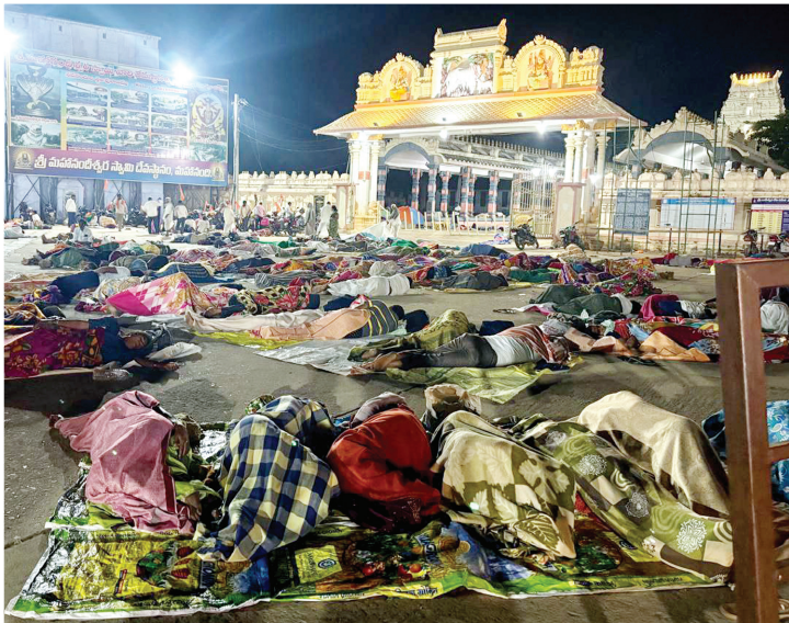
అలయం ముందు భాగంలో సేదతీరుతున్న కన్నడీకులు

మహానంది, మేజర్ న్యూస్ : మహానంది పుణ్యక్షేత్రంలో కన్నడ భక్తులకు సౌకర్యాలు కల్పించడంలో అధికారులు విఫలమయ్యారనే చెప్పొచ్చు. సుదూర ప్రాంతాల నుంచి వ్యయప్రయాసలతో కన్నడీకులు క్షేత్రానికి చేరుకుంటే వారు నిద్రించేందుకు సరైన వసతులు లేక ఇబ్బందులు ఎదురౌతున్నారని పర్వదినం కంటే ముందు 10 రోజుల నుంచి కన్నడీకులు మిగతా రైల్వే