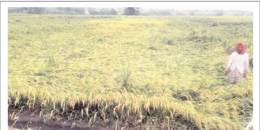
మండలంలో నెలకొరిగిన వరి పైరును చూపిస్తున్న రైతు ఈరమ్మ

సి.బెజగల్ మేజర్ న్యూస్ : చేతికొచ్చిన వరి పంట వడగండ్ల వాన ప్రతాపానికి నెలకొరిగి రైతుకు దుఃఖని మిగిల్చింది. మండలంలో శనివారం కురిసిన వడగండ్ల వానకు వరి పంట నెలకొరిగిన ఘటనలో సి.బెజగల్ మండల కేంద్రంలో రైతులు మనోవేదన చెందారు. మండలంలో స్థానిక సి. బెజగల్, పలుకుదాడ్డి, కృష్ణదొడ్డి, బూరన్ దొడ్డి, గొల్ల దొడ్డి గ్రామాల రైతులు చెరువు పై ఆధారపడి వ్యవసాయం చేస్తారు. ప్రతి ఏటా ఖరీఫ్ సీజన్ లో వచ్చే వర్షాలకు చెరువు నిండితేనే రబీ సీజన్ లో రైతులు వరి పంట సాగు చేస్తున్నారు. అయితే ప్రతి ఏటా లాగే ఈ సంవత్సరం కూడా రబీ సీజన్లో వరి పంట సాగుచేసిన రైతులకు వర్షం ఒక్కొక్కసారి వచ్చే సమయం వచ్చింది. చేతికొచ్చిన పంట పై వర్షం వడగండ్ల తో విభృభించింది. దానితో వరి పంట నెలకొరిగింది. నెలకొరిగిన పంటను చూసి రైతు గుండె నిండా భారంతో నెలకొరిగిన నీట మునిగిన పంటను కర్రల, తాజ్ సాయంతో కటి నిలిపే ప్రయత్నం చేస్తున్న దృశ్యాలు మండలంలో చోటుచేసుకున్నాయి.