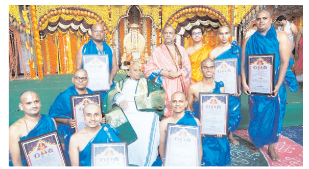
ప్రశంసా పత్రాలతో విద్యార్థులు