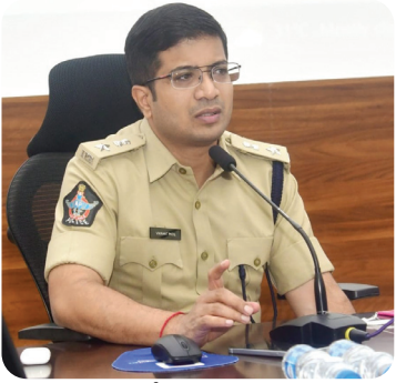
జిల్లా ఎస్పీ విక్రాంత్ పాటిల్