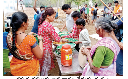
కన్నడ భక్తులకు అన్నదానం చేస్తున్న దుర్గమ్మ లకు చెందిన వారు, దాతలు పలు రకాల సేవలు అందిస్తు తరిస్తున్నారు. అన్నదానం, అల్పాహారం, శీతలపానీయాలు భక్తులకు అందిస్తు ఉచిత వైద్య శిబిరాలు కూడా ఏర్పాటు చేశారు. తర తరలా ఆచారా వ్యవహారాలను, భక్తి భావాన్ని పెంపొందించుకొని చిన్నారులు మొదలు వయో వృద్ధుల వరకు శ్రీశైలానికి కాలినడకన చేరుకోవడం ప్రతి ఏడు ఉగాది ఉత్సవాల్లో ప్రత్యేకత.