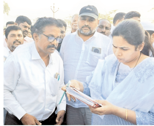
అధికారులతో వివరాలు తెలుసుకుంటున్న ఎమ్మెల్యే

పడతారని అన్నారు. ఆళ్ళగడ్డ నియోజకవర్గంలో రైతులకు నీరు అందడం లేదని అన్నారు. ఇదే విషయాన్ని ఆసెంట్లీలో మాట్లాడటం జరిగిందని అన్నారు. అధికారంలో ఉన్నా లేకపోయినా రైతుల పక్షాన పోరాడుతూనే ఉంటామని అన్నారు. అధికారులు పొన్నాపురం వద్దకు 5 అడుగుల నీటి మట్టం