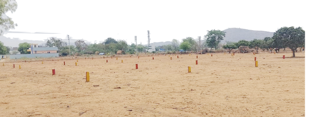
315 నర్సే నెంబర్లో అనుమతులు లేకుండా ప్లాట్లు వేసిన రియాలర్లు