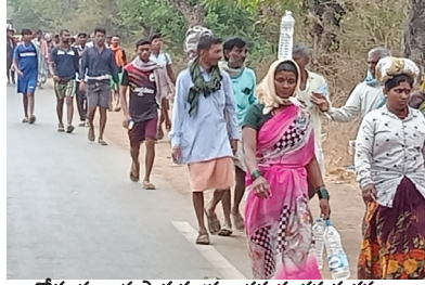
రోడ్డు మార్గాన పాదయాత్రగా వస్తున్న కన్నడ భక్తులు బిక దేవిని దర్శించి పండుగకు ఆహ్వానించేందుకు ఎంతో ఉత్సాహంతో బీరసారితో సమర్పించేందుకు వెళ్తున్నారు. 901 సంవత్సరాల నుంచి కొనసాగుతున్న సాంప్రదాయాన్ని కాపాడుతూ కన్నడికులు ఎంతో భక్తి శ్రద్ధలతో శ్రీశైలానికి తరలివెళ్తున్నారు. ఎండలను సైతం లెక్కడ చేయకుండా శ్రీగిరివైపు అడుగులు వేస్తున్న కన్నడ భక్తులకు అటవీ మార్గంలో అడుగుడుగున బ్రష్టు

పాదయాత్రగా వెళ్తున్నారు. శ్రీగిరి, శ్రీపర్వతం ఈ రెండు పర్యాటక ప్రదేశాలైనా శ్రీ మల్లికార్జునుడు భ్రమరాంబదేవితో విడదీయ రాని బంధం ఉన్న పవిత్ర రూపాలు. రూపాలు ఏవైనా శ్రీశైల పర్వతంపై తమ ఇంటి ఆడపడుచు భ్రమరాంబ దేవి పతి పరమశివుడు మల్లన్నతో ఉంటున్న ఇంటికి అధిత్యం కోసం అడుగులను దాటుతూ వెళ్తున్నారు. కర్నాటక వాసులు, ఆ పొరుగునే ఉన్న మహారాష్ట్ర భక్తులు సైతం వెంట కదులుతున్నారు. మహాపర్వతం ఉగాది నాటికి ఆది దేవున్ని పూజించాలనే సంకల్పంతో వేలాది మంది కన్నడ, మహారాష్ట్ర భక్తులు ఆత్మకూరు నల్లమల అడవుల గుండా కాలినడకన వెళ్తున్నారు. భూమండలానికి నాభిస్థానంగా పురాణాలు చెబుతున్న శ్రీశైలం క్షేత్రంలో చెంచులు పూజలు నిర్వహించే వారు. తమ ఇంటి ఆడపడుచుగా భావించి శ్రీభ్రమరాం