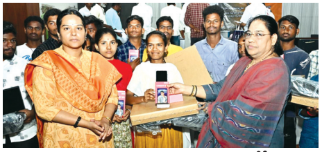
విద్యార్థులకు ల్యాప్ టాప్ అందిస్తున్న జేసీ