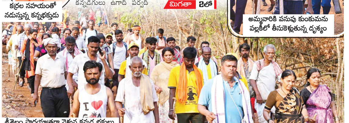
శ్రీశైలం పాదయాత్రగా వెళ్తున్న కన్నడ భక్తులు