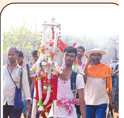
అమ్మవారికి పసుపు కుంకుమలు పల్లకీలో తీసుకెళ్తున్న దృశ్యం

నానికి పసుపు కుంకుమలు ను శిరస్సుపై మోస్తూ నల్లమల గుండా కాలినడకన శ్రీగిరి చేరేందుకు ముందుకు సాగుతున్నారు. ఉగాది ఉత్సవాలకు తమ ఆడపడమను కనులార తనవిటి రేంత వరకు వీక్షించేందుకు ముందుకుంటూ సైతం లెక్కచేయకుండా ఆదుకో మల్లయ్య, మమ్ము రక్షింపు మల్లయ్య అంటూ