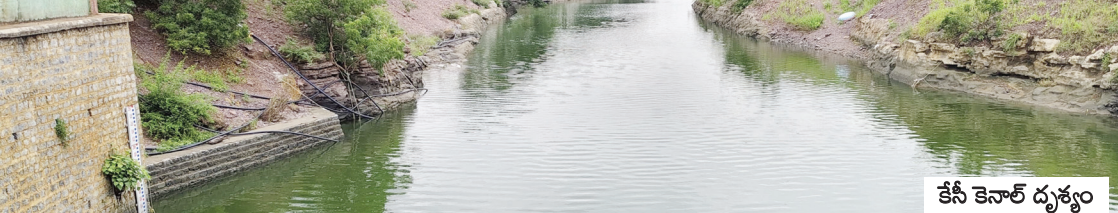
కేసీ కెనాల్ దృశ్యం