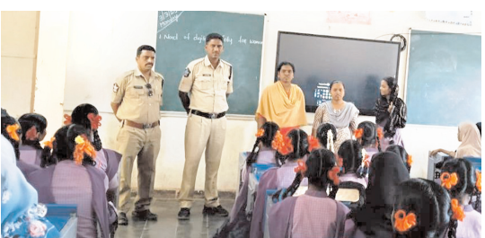
విద్యార్థినిలకు అవగాహన కల్పిస్తున్న పోలీసులు

కర్నూలు క్రెం, మేజర్ న్యూస్ : మహిళా దినోత్సవాన్ని పురస్కరించు కుని సోమవారం జిల్లాలోని పాఠశాలలు, కళాశాలలో 4వరోజు మహిళా సాధికారత వారోత్సవాలు కొనసాగాయని జిల్లా ఎస్సీ విక్రాంత్ పాటిల్ తెలిపారు. ఇందులో భాగంగా మంగళవారం కర్నూలు, అదోని,