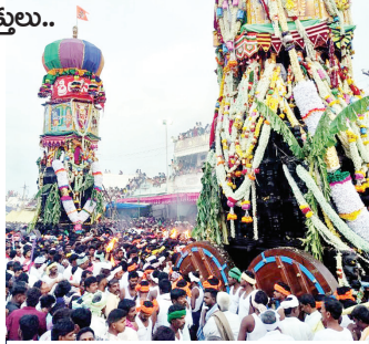
అశేష భక్తజనం మధ్య ఊరేగుతున్న గాదిలింగేశ్వర స్వామి రథోత్సవాలు

స్వామికి ఉదయం అభిషేకాలు, నైవేద్యాలతో అర్చకులు ప్రత్యేక పూజలు చేశారు.కుంకుమార్చన ,రుద్రాభిషేకం,మహా మంగళ హారతులు ఇచ్చి పూలమాలలతో స్వామి వారిని అలంకరించారు. అనంతరం కర్ణాటక,ఆంధ్ర ఇతర చుట్టు పక్కల ప్రాంతాల నుండి వచ్చిన భక్తుల మధ్య