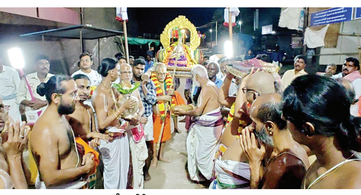
విశ్వేశ్ నుడికి పూజలు నిర్వహిస్తున్న అర్చకులు