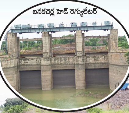
బనకచెర్ల హెడ్ రెగ్యులేటర్