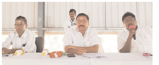
మహానంది క్షేత్రంలో వేలాల నిర్వహిస్తున్న దృశ్యం