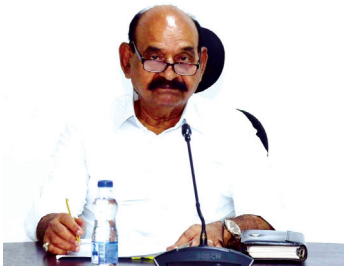
రాష్ట్ర న్యాయ మైనార్టీ సంక్షేమ శాఖ మంత్రి ఎన్ఎండి ఫరూక్

నంద్యాల కల్చరల్, మేజర్ న్యూస్ : రంజాన్ మాసంలో రాష్ట్రంలోని ఉర్దూ పాఠశాలలకు పనివేళల మార్పు చేస్తూ ప్రభుత్వ ఉత్తర్వులు జారీ చేసినట్లు రాష్ట్ర న్యాయ మైనార్టీ సంక్షేమ శాఖ మంత్రి ఎన్ఎండి ఫరూక్ తెలిపారు. ఈమేరకు అమరావతి లో మంగళవారం ఒక ప్రకటన విడుదల చేశారు. రంజాన్ పవిత్ర మాసంలో వివిధ ప్రభుత్వ శాఖల్లో పనిచేసే ముస్లిం ఉద్యోగులు సాయంత్రం పనివేళల ముగింపు కంటే ఒక గంట సమయం ముందుగానే బయటకు వెళ్లేందుకు అనుమతులు మంజూరు చేస్తూ ప్రభుత్వం గత నెలఖరులోనే ఉత్తర్వులు జారీ