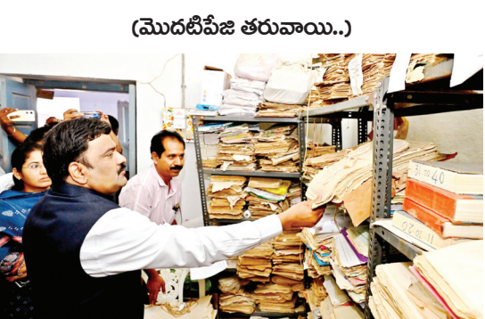
(మొదటిపేజి తరువాయి..) తహశీల్దార్ కార్యాలయంలో రికార్డులను కలెక్టర్ తనిఖీ చేస్తున్న దృశ్యం