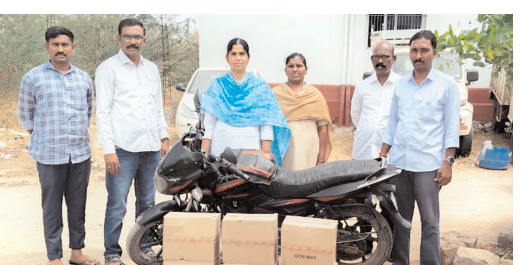
పట్టుబడ్డ కర్ణాటక మద్యంతో ఎక్స్ ట్రా పోలీసులు.

అలూరు, మేజర్ న్యూస్ : కర్ణాటక లోని మోకా నుండి అక్రమంగా తరలిస్తున్న కర్ణాటక మద్యాన్ని చిప్పగిరి మండలం సంగాల గ్రామం వద్ద దాడులు చేసి అక్రమ మద్యాన్ని తరలిస్తున్న ఒక వ్యక్తిని పట్టుకొని అతని వద్దనుండి 7