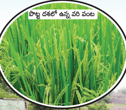
పొట్ట దశలో ఉన్న వరి పంట