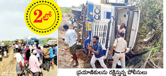
ప్రయాణికులను రక్షిస్తున్న పోలీసులు