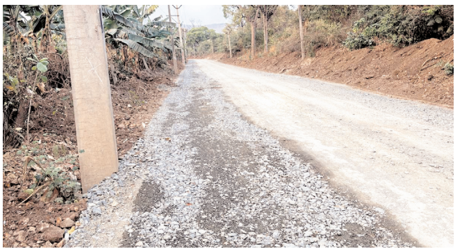
దారికి అడ్డుగా ఉన్న విద్యుత్ స్తంభాలు వేగవంతంగా పూర్తి చేయాలని భక్తులు, రైతులు, ప్రజలు కోరుతున్నారు. స్తంభాలు తొలగింపునకు