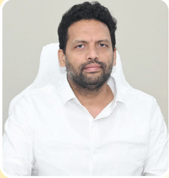
రాష్ట్ర మంత్రి టీజీ భరత్

● ప్రజల సమస్యలు తెలుసుకునేందుకు కొత్త కార్యక్రమం చేపట్టనున్న రాష్ట్ర మంత్రి టీజీ భరత్