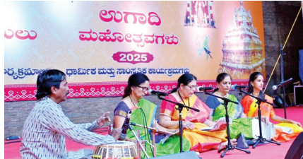
ఉగాది మహోత్సవాలకు వేళాయో