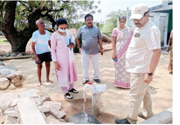
కొత్తకోట గ్రామంలో త్రాగునీటిని పరిశీలిస్తున్న అధికారులు

-గ్రామాలను సందర్శించిన మండల నోడల్ అధికారి, ఎంపీడిఓ. ఆర్డీవీఎస్. ఏఈ.