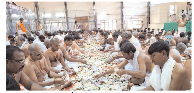
హుండీ ఆదాయం లెక్కిస్తున్న దృశ్యం

శ్రీశైలం, మేజర్ న్యూస్: శ్రీశైలం భ్రమరాంబ మల్లికార్జున స్వామి అమ్మవార్ల ఉభయ దేవాలయాల హుండీల ఆదాయాన్ని బుధవారం లెక్కించారు. భక్తులు గత 16 రోజులలో సమర్పించిన కాసుకల్లో రూ.5,69,55,455 నగదు రాబడి తోపాటు 87 గ్రాముల 500 మిల్లీగ్రాముల బంగారం, 5 కేజీల 850 గ్రాముల వెండి ఆదాయంగా చేకూరుంది. అదేవిధంగా యుఎస్ఎ డాలర్లు 885, యూఎఈ డిల్లమ్స్ 105, యూకే ఫౌండ్స్ 80, సింగపూర్ డాలర్లు 2, కెనడా డాలర్లు 5 మొదలైన విదేశీ కరెన్సీ కూడా ఈ హుండీల లెక్కింపులో లభించాయి. వటిష్టమైన భద్రతా ఏర్పాట్ల మధ్య సీసీ కెమెరాల నిఘాతో ఈ లెక్కింపును చేపట్టడం జరిగింది. ఈ కార్యక్రమంలో దేవస్థానం అధికారులు, సిబ్బంది, శివసేవకులు తదితరులు పాల్గొన్నారు.