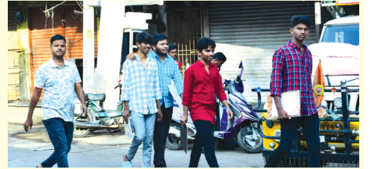
పరీక్ష కేంద్రంలోకి వెళ్తున్న విద్యార్థులు