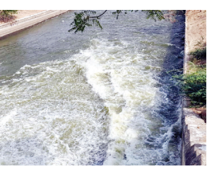
నీటిని విడుదల చేసిన దృశ్యం

ఎమ్మెల్యే భూమా అఖిల ప్రియ కు కృతజ్ఞతలు తెలిపిన రైతులు అల్లగడ్డ, మేజర్ న్యూస్ : ఎమ్మెల్యే భూమా అఖిల ప్రియ చొరవతో బుధవారం అధికారులు కేసీ కెనాల్ కు నీటిని విడుదల చేశారు. కేసీ కెనాల్ చివరి ఆయకట్టు వరకు సాగునీరు అందిస్తామని ఆందోళన వద్దని ఎమ్మెల్యే అఖిల ప్రియ మంగళవారం రైతులకు హామీ ఇవ్వడం జరిగింది. ఇచ్చిన మాట ప్రకారం బుధవారం సుంకేసుల నుండి 1700 క్యూసెక్కులు, అలాగే మల్వాల నుండి 650 క్యూసెక్కులు మొత్తం 2250 క్యూసెక్కులు నీటి నీ కేసీ కెనాల్ కు విడుదల చేయడం జరిగింది. కేసీ కెనాల్ కు నీరు రావడంతో రైతులు ఆనందం వ్యక్తం చేశారు. ఎమ్మెల్యే భూమా అఖిల ప్రియ కు ఎప్పటికీ రుణపడి ఉంటామని కేసీ కెనాల్ ఆయకట్టు రైతులు తెలిపారు.