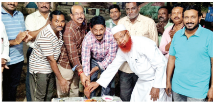
సంబరాలు చేసుకుంటున్న ఉపాధ్యాయులు