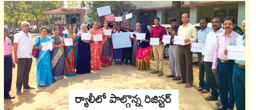
ర్యాలీలో పాల్గొన్న రిజిస్టర్