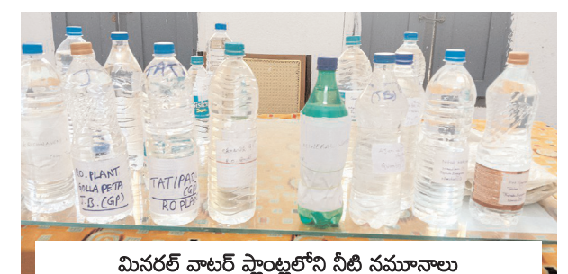
మినరల్ వాటర్ ప్లాంట్‌లోని నీటి నమూనాలు