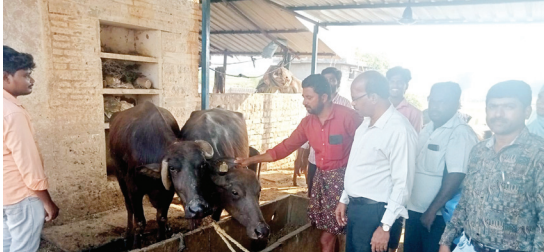
టీకా కార్యక్రమాన్ని పరిశీలిస్తున్న డి.డి