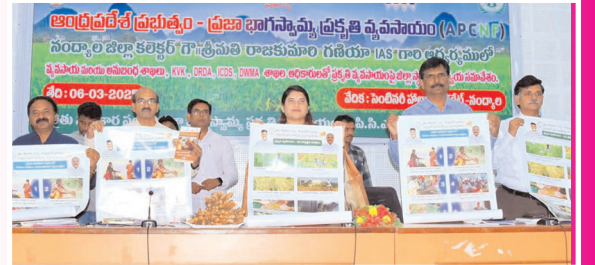
పంటల పోస్టర్ ను ఆవిష్కరిస్తున్న కలెక్టర్, వ్యవసాయాధికారులు