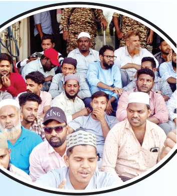
కార్ల ఎదుట ఎన్డిపిఐ నిరసన దిగారు. మిగతా 2లో

నంద్యాల, మేజర్ స్కూల్స్ బ్యారో: నంద్యాల జిల్లా కేంద్రంలో ఎన్సోర్స్ మెంట్ డైరెక్టరేట్ అధికారులు సోదాలు నిర్వహించారు. ఆత్మకూరు బస్టాండ్ సమీపంలోనే సోషియల్ డెమోక్రటిక్ పార్టీ ఆఫ్ ఇండియా కార్యాలయంలో గురువారం ఉదయం సుంచి సాయంత్రం వరకు ఇడి అధికారులు తనిఖీలు నిర్వహించారు. గురువారం ఉదయం కేంద్ర బలగాలతో కార్యాలయం వద్దకు చేరుకున్న ఇడి అధికారులు సుమారు 8 గంటల పాటు తనిఖీ చేశారు. కార్యాలయంలో ఇడి అధికారులు తనిఖీ చేస్తున్న విషయం తెలిసిన వెంటనే ఆ పార్టీ కార్యకర్తలు పెద్ద ఎత్తున అక్కడి చేరుకొని ఆందోళనకు మిగతా 2లో