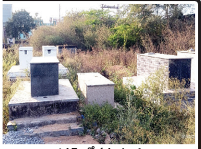
గత నెలలో సమాధులను ద్వంసం చేసిన దృశ్యం ( ఫైల్ ఫోటో )

చాగలమర్రి, మేజర్ న్యూస్ : నంద్యాల జిల్లాకు చివరి మండలం అయినట్లుంటే చాగలమర్రి లో వరుస సంఘటనలతో భయాందోళనకు, గురవుతున్నారు. చాగలమర్రి టౌన్ నిత్యము వ్యాపారాలతో కళకళలాడుతుండేది, అయితే ఒక నెల వ్యవధిలోనే పలు సంఘటనలు చోటు చేసుకోవడంతో భయాందోళనకు గురి కావాల్సి వస్తుంది. గురువారం తెల్లవారిన తర్వాత చాగలమర్రి లోని సిట్టివీడు బస్టాండు మన గ్రోమోర్ ఎదురుగా ప్రాంతంలో పాతబడిన బైకులు కాలిపోయాయి. ఈ బైకులు ఆకతాయిలు చేసిన పనా లేక కావలసి చేసినా అనేది అర్థం కావడం లేదు. గత వారంలో పూల అంగళ్లు దగ్ధం కాగా, ఇంతకుముందు రెండు వారాల క్రితం స్వశాసనములోని సమాధులపై ఉన్న సిలువలను పగలగొట్టడం ఇలాంటి వర్ష సంఘటనలు చూసి ప్రజలు భయాందోళనకు గురవుతున్నారు. చాగలమర్రిలో నిఘా నేత్రాలు ఉన్నప్పటికీ ఈ సంఘటనలు నిత్యం జరుగడము కోసమెరుపు..