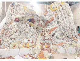
పూజలు అందుకుంటున్న స్వామి వారి జీవనమాధి