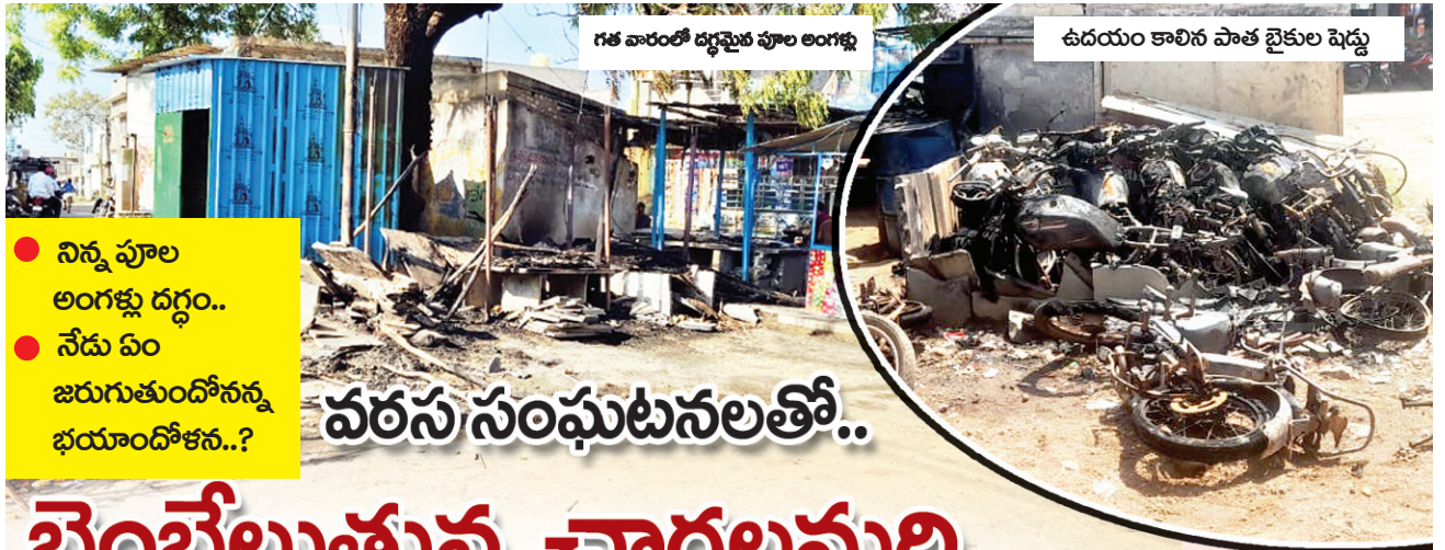
గత వారంలో దగ్గరైన పూల అంగళ్లు