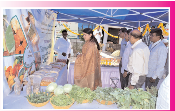
పండించిన పంటల స్వాచ్ఛను పరిశీలిస్తున్న కలెక్టర్ రాజకుమారి