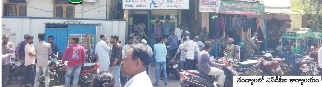
నంద్యాలలో ఎన్డిపిఐ కార్యాలయం