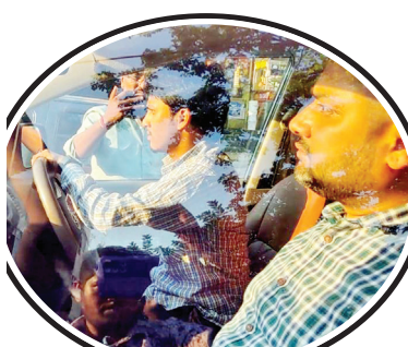
కార్యాలయానికి చేరుకున్న ఈడి అధికారులు

నంద్యాల, మేజర్ స్కూల్స్ బ్యారో: నంద్యాల జిల్లా కేంద్రంలో ఎన్సోర్స్ మెంట్ డైరెక్టరేట్ అధికారులు సోదాలు నిర్వహించారు. ఆత్మకూరు బస్టాండ్ సమీపంలోనే సోషియల్ డెమోక్రటిక్ పార్టీ ఆఫ్ ఇండియా కార్యాలయంలో గురువారం ఉదయం సుంచి సాయంత్రం వరకు ఇడి అధికారులు తనిఖీలు నిర్వహించారు. గురువారం ఉదయం కేంద్ర బలగాలతో కార్యాలయం వద్దకు చేరుకున్న ఇడి అధికారులు సుమారు 8 గంటల పాటు తనిఖీ చేశారు. కార్యాలయంలో ఇడి అధికారులు తనిఖీ చేస్తున్న విషయం తెలిసిన వెంటనే ఆ పార్టీ కార్యకర్తలు పెద్ద ఎత్తున అక్కడి చేరుకొని ఆందోళనకు మిగతా 2లో