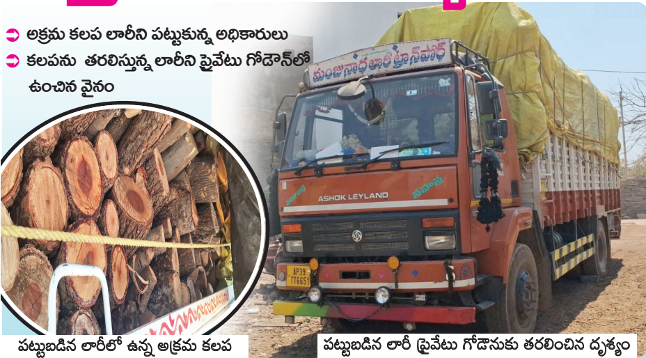
పట్టుబడిన లారీలో ఉన్న అక్రమ కలప