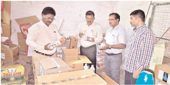
తనిఖీలు నిర్వహిస్తున్న ఏడీఏ, ఏవోలు