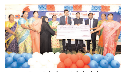
మోగా చెక్కును అందిస్తున్న దృశ్యం