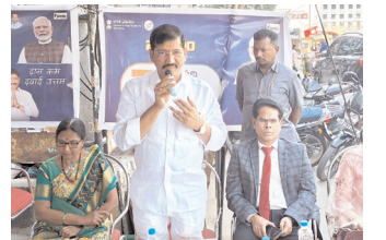
మాట్లాడుతున్న ఎంపి బస్తిపాటి నాగరాజు

కర్నూలు క్రైం, మేజర్ న్యూస్ : జనరిక్ మందులపై అందరికీ అవగాహన కల్పించాల్సిన అవసరం ఎంతైనా ఉందని కర్నూలు ఎంపి బస్తిపాటి నాగరాజు అన్నారు. శుక్రవారం నగరంలో ప్రభుత్వ ఆసుపత్రి ఎదురుగా ఉన్న జన ఔషధ కేంద్రంలో నిర్వహించిన