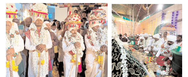
స్వామివారికి జయారత్ గంధం అందజేస్తున్న పీఠాధిపతులు

గోనెగండ్ల, మేజర్ న్యూస్ : గంజహళ్లి గ్రామంలో వెలసిన మహాత్మ బడేసాహెబ్ స్వామి వారి ఉరుసు మహోత్సవం శుక్రవారం జయారత్ గంధం తో ఘనంగా ముగిసింది. ఉదయం నుంచి దర్గా పీఠాధిపత శ్రీలు స్వామి వారి గంధంతో మేకతాళలతో ఉరేగింపుగా దర్గాను చేరుకొని ప్రత్యేక ప్రార్థనలు చేశారు. స్వామి వారి జీవనమాది కి భక్తితో గంధం పట్టించారు. సమాధిని పూలతో అలంకరించి ప్రత్యేక ప్రార్థనలు చేశారు. ఈ కార్యక్రమానికి భక్తుల పెద్ద సంఖ్యలో హాజరయ్యారు. పీఠాధిపతుల ఇంటి నుంచి గంధంను దర్గాకు తీసుకువెలు తున్న మార్గంలో భక్తులు పీఠాధిపతులను ప్రత్యేకంగా పూలు, జలం, అత్తరుతో పూజించారు. స్వామివారి ఉరుసు సందర్భంగా పలు ప్రాంతాల నుంచి దాదాపు 2 లక్షల మంది భక్తులు హాజరైపట్లు తెలిసింది.