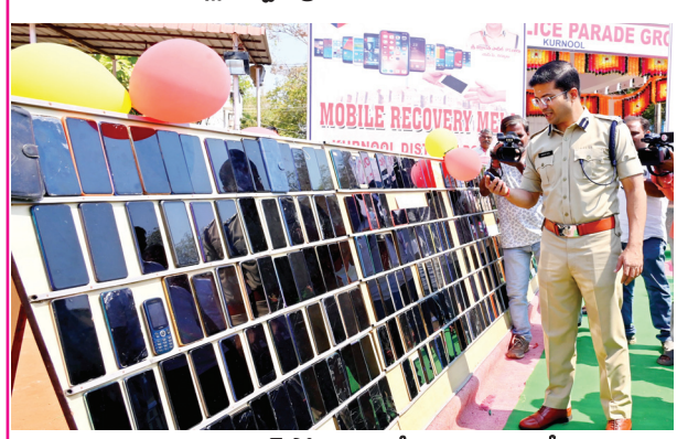
పట్టుబడిన మొబైల్ ఫోన్లను పరిశీలిస్తున్న జిల్లా ఎస్పీ

◆ రూ.1 కోటి 20 లక్షలు విలువ చేసే మొబైల్ ఫోన్లు బాధితులకు అందజేసిన జిల్లా ఎస్పీ విక్రాంత్ పాటిల్