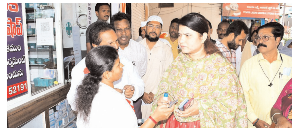
రైతునగర్లో ఉన్న జనరిక్ మందుల దుకాణాన్ని పరిశీలిస్తున్న కలెక్టర్