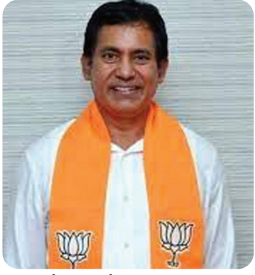
ఆదోని ఎమ్మెల్యే డాక్టర్ పార్థసారధి