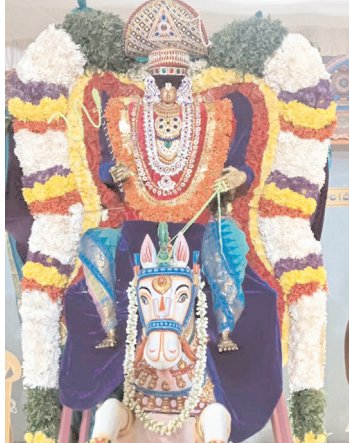
రోజులుగా నిత్య కళ్యాణం నిర్వహిస్తోన్న ఆలయ నిర్వాహకులు ఏటా రెండు సార్లు బ్రహ్మాోత్సవాలు కూడా నిర్వహిస్తున్నారు.

నగర శివార్లలో వెలసిన గోదాగోకులం ద్వితీయ వార్షికోత్సవాలు శుక్రవారం పూర్తయ్యాయి. ఐదు రోజులుగా వార్షికోత్సవాలను అత్యంత వైభవంగా నిర్వహించారు. శ్రీ గోదా రంగనాథ స్వామి వార్ల కళ్యాణోత్సవాన్ని కనులవిందుగా నిర్వహించారు. ఆలయ మాడ వీధుల్లో ఉదయం, రాత్రి గోదా రంగనాథులను వివిధ వాహనాలపై ఊరేగించారు. శుక్ర వారం సింహ, అశ్వ వాహనాలపై స్వామి వారు మాడ వీధుల్లో విహరించి భక్తులను అనుగ్రహించారు. శుక్రవారం చక్రస్నానం కార్యక్రమాన్ని ఆధ్యాత్మిక వాతావరణంలో నిర్వహించారు. 108 నిర్వాణాలతో గోదా గోకులం అత్యంత వైభవంగా నిర్వహించారు. మాడ వీధులు కూడా ఉండడం ఈ ఆలయం ప్రత్యేకం. నెల