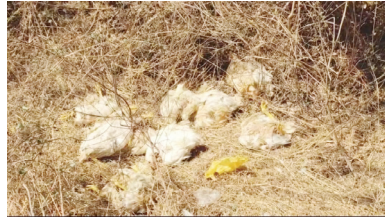
చికెన్ వ్యర్థ పదార్థాలు

సంబంధిత అధికారులు చికెన్ సెంటర్లపై చర్యలు తీసుకోవాలి