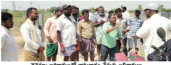
రెవెన్యూ అధికారులతో వాగ్వివాదం చేస్తున్న లబ్ధిదారులు