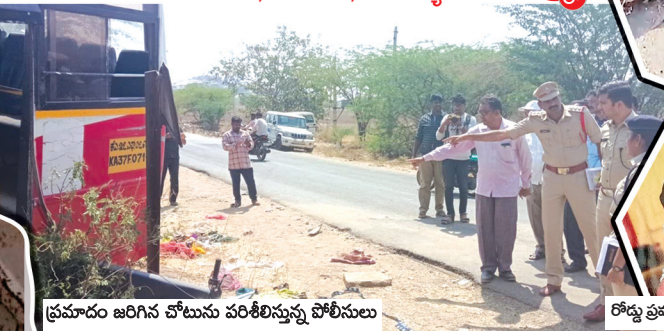
ఆదిని, ఆదిని టౌన్, మేజర్ న్యూస్: