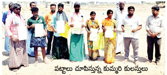
పట్టాలు చూపిస్తున్న కుమ్మరి కులస్థులు