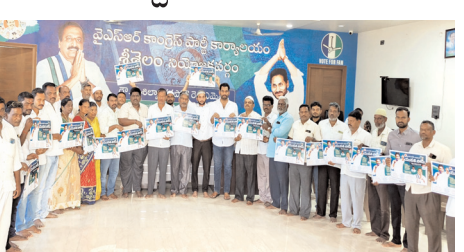
పోస్టర్లను విడుదల చేస్తున్న వైసిపి నాయకులు