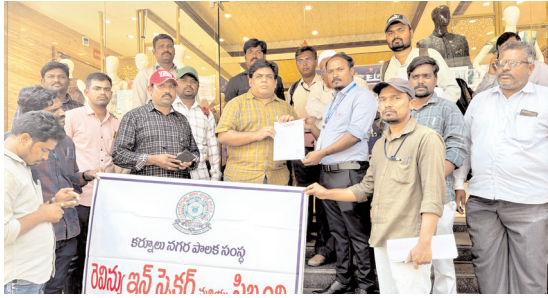
యాజమాన్యం నుండి లిఖితపూర్వక లేఖను అందుకుంటున్న అధికారులు

కర్నూలు నగరం, మేజర్ న్యూస్ : కర్నూలు నగరపాలక సంస్థ సౌకర్యాలను ఉపయోగించుకుంటూ పన్నులు చెల్లించని బకాయిదారులపై నగరపాలక కొరడా ఝులిపిస్తోంది. ఆర్థిక సంవత్సరం ముగుస్తున్న