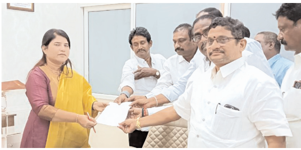
కలెక్టర్ కు వినతిపత్రం అందజేస్తున్న రైతులు

- కేసీ కెనాల్ 16వ బ్లాక్ వద్ద 5 గేజీల నీరు విడుదల చేయండి - కలెక్టర్‌ను కలిసిన గోస్పాడు రైతులు