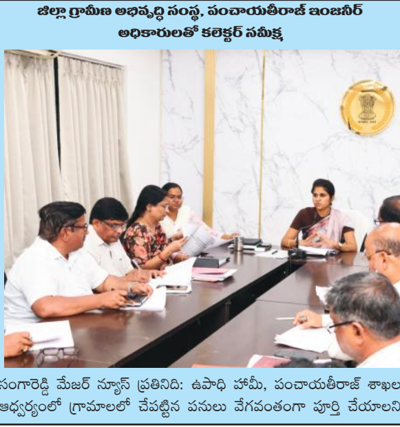
సింగారెడ్డి మేజర్ న్యూస్ ప్రతినిధి: ఉపాధి హామీ, పంచాయతీరాజ్ శాఖల ఆధ్వర్యంలో గ్రామాలలో చేపట్టిన పనులు వేగవంతంగా పూర్తి చేయాలని