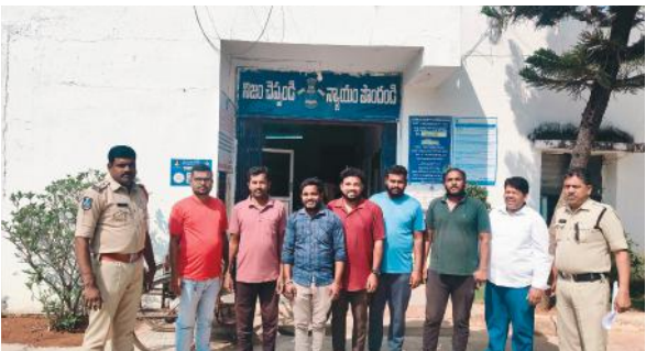
దుబ్బాక సూర్యమేజర్ న్యూస్: రాష్ట్ర అసెంబ్లీ ముట్టడికి బయలుదేరిన భారత్ రాష్ట్ర సమితి విద్యార్థి విభాగ నాయకులను అక్రమంగా అరెస్టు చేయడం