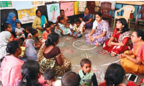
కొండాపూర్ మేజర్ స్కూల్స్: అంగన్వాడి సెంటర్లో పిల్లలకు అందిస్తున్న సేవలపై శనివారం మల్లాపూర్ అంగన్వాడి సెంటర్ ను కలెక్టర్ వల్లూరి

- అంగన్వాడి సేవలు వినియోగించుకోవాలి : కలెక్టర్ వల్లూరి క్రాంతి