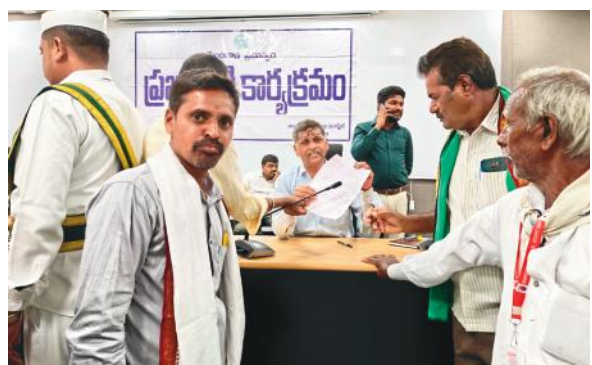
స్పందించి సాగునీరు సమస్యను పరిష్కరించే దిశగా చర్యలు చేపట్టాలని కోరారు.

సిద్దిపేట ప్రతినీధి, మేజర్ న్యూస్ : భూగర్భ జలాలు అడుగంటిపోవడం వల్ల సాగు నీరు అందకపోవడంతో ఎండిన పంటలను చూసి గుండె తలుక్కు పోవడం వల్ల జిల్లా పరిధిలోని మిరుదొడ్డి మండల కేంద్రానికి చెందిన రైతులతో పాటు పరిసర గ్రామాల రైతులు సోమవారం రోజున కలెక్టరేట్ లో నిర్వహించిన ప్రజావాణిలో పంటల సాగు నీటి కోసం గోడు వెళ్లబోసుకున్నారు. ఈ సందర్భంగా వారు మాట్లాడుతూ మల్లన్న సాగర్ జలాశయం తాలాపుకే ఉన్న పంటలకు సాగు నీరు లేక పంటలుఎండిపోతున్నాయంటూ అవేదన వ్యక్తం చేశారు. కూడవెల్లి వాగు నుండి మల్లన్న సాగర్ జలాలు సిరిసిల్ల వరకు వెళ్తున్నప్పటికీ పాలకుల వివక్ష దోరణి వల్ల మిరుదొడ్డి మండల కేంద్రముతో పాటు పరిసరగ్రామాల రైతులకు అన్యాయం జరుగుతుందంటూ మండి పడ్డారు. కాలవల తవ్వకాలను పూర్తి చేసి చెరువులను నీటి తో నింపితే భూగర్భ జలాలు పెరుగుతాయని దీనితో సాగు నీరుకు ఇబ్బందులు ఏర్పడవని అన్నారు. ఇప్పటి కైనా అధికారులు