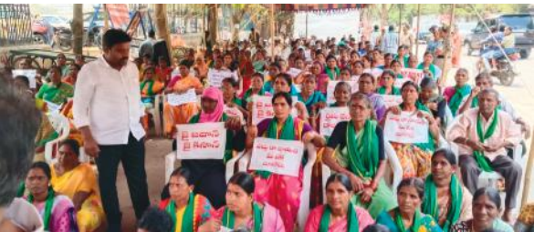
గుమ్మడిదల మేజర్ న్యూస్ : గుమ్మడిదల మండల పరిధిలోని ప్యారా నగర్ లో ఏర్పాటు చేస్తున్న డంపింగ్ యార్డ్ ను వెంటనే తొలగించాలి అంటూ

మండల పరిధిలోని గ్రామాల ప్రజలు నిరసన దీక్షలు చేస్తూనే ఉన్నారు, సోమవారానికి 48 రోజులు పూర్తి కావస్తున్న ప్రభుత్వం నుంచి ఎలాంటి స్పందన లేదు అంటూ మహిళలు గ్రామాల ప్రజలు యువత వివిధ యువజన సంఘాల సభ్యులు ఇతర పార్టీల నాయకులు గ్రామాల ప్రజలకు మద్దతు తెలుపుతున్నారు, ఇప్పటికైనా ప్రభుత్వం ఆలోచించి డంపింగ్ యార్డ్ జీవోను రద్దుచేసి మా గ్రామాలను కాపాడాలని వారు వేడుకుంటున్నారు. సోమవారం నాడు గుమ్మడిదల మండల పరిధిలోని జెఎసి నాయకులు యువజన సంఘాల సభ్యులు మహిళలు అంతా కలిసి ఇందిరా పార్క్ ధర్నా చౌక్ లో ధర్నా నిర్వహించారు.ద ఈ కార్యక్రమంలో గ్రామ మహిళలు జేపీసీ నాయకులు తదితరులు పాల్గొన్నారు.