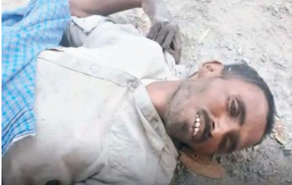
గుర్తిస్తే 87126 56746 నెంబరుకు ఫోన్ చేసి సమాచారం అందించాలని పోలీసులు విజ్ఞప్తి చేశారు