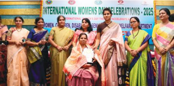
చదువే మహిళా సాధికారతకు ప్రధాన ఆధారం:

అమ్మాయిలు చదువు ఆ కుటుంబానికి వెలుగును ఇస్తుందని కలెక్టర్ తెలిపారు. తల్లిదండ్రులు తమ కుమార్తెకు పూర్తి స్వేచ్ఛను ఇస్తూ మంచి విద్యను అందించాలని కలెక్టర్ సూచించారు. కేజీబీవీ, గురుకుల పాఠశాలలో వసతి గృహాలలో చదువుతున్న బాలికల భవిష్యత్తు కోసం ప్రత్యేక అవగాహన కార్యక్రమాలు నిర్వహించేందుకు కృషి చేస్తున్నట్లు కలెక్టర్ తెలిపారు.