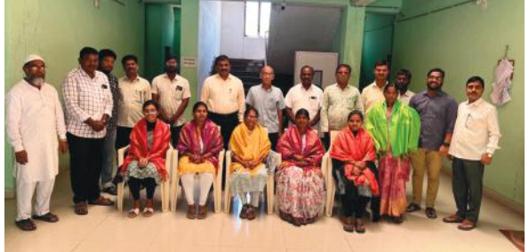
మెదక్ మేజర్ న్యూస్ ప్రతినీధి...మహిళా శక్తిని, యుక్తిని చాటిచెప్పేలా మార్చి 8న అంతర్జాతీయ మహిళా దినోత్సవం ఘనంగా నిర్వహించుకోవాలని జడ్పీ

మహిళా దినోత్సవం ఘనంగా నిర్వహించాలి : జడ్పీ సీఈఓ ఎల్లయ్య