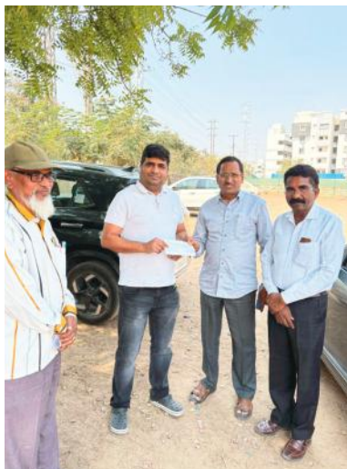
జిన్నారం మేజర్ స్కూల్:బొల్లారం మున్సిపాలిటీ పరిధిలో ఆస్తి పన్ను వసూలు ప్రక్రియ జోరుగా కొనసాగుతోంది. నిర్దేశించిన లక్ష్యాల మేరకు

అధికార యంత్రాంగం బృందాలను ఏర్పాటు చేసి పన్ను వసూళ్లు చేపడుతున్నారు. శనివారం కమిషనర్ పి.మధుసూదన్ రెడ్డి మాట్లాడుతూ... ఇప్పటివరకు మున్సిపాలిటీలో 70.85% శాతం పన్ను వసూళ్ల ప్రక్రియ చేపట్టడం జరిగిందన్నారు. మొండి బకాయి చెల్లింపుదారులకు రెడ్ నోటీసులు జారీ చేస్తూ ఆస్తులు జప్తు చేసేందుకు వెనుకాడబోమని హెచ్చరించారు. 100% శాతం లక్ష్యంగా పన్ను వసూళ్ల ప్రక్రియలో ముందుకు వెళుతున్నట్లు తెలిపారు. మాతామూకి ఇండియా ప్రైవేట్ లిమిటెడ్ యాజమాన్యం శనివారం 8,16,0024 రూపాయలు ఆస్తి పన్ను చెక్కు రూపంలో చెల్లించినట్లు తెలిపారు. సి డి ఎం ఏ ఆదేశాల ప్రకారం యాక్సిస్ బ్యాంకు ద్వారా అదనంగా మరోపది అడనపు హ్యాండ్ మిషన్లు ఏర్పాటుచేసి జోరుగా పన్ను వసూళ్లు చేపడుతున్నట్లు తెలిపారు. ఏడు శానిటేషన్ వాహనాలలో పన్ను కలెక్టర్లకు సంబంధించి ప్రచారాన్ని నిర్వహిస్తూ గడువు తేదీలోగా