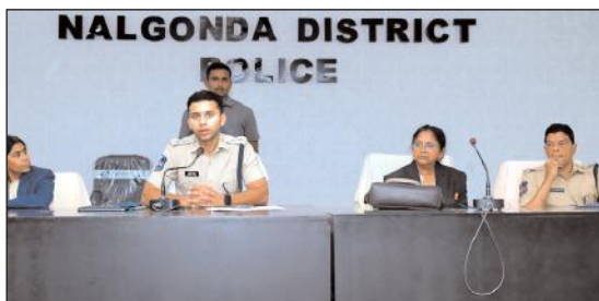
NALGONDA DISTRICT POLICE