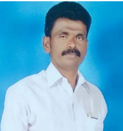
ఉదయగిరి, మేజర్స్ న్యూస్ : రాష్ట్ర బడ్జెట్లో ముఖ్యమంత్రి చంద్రబాబునాయుడు సంక్షే