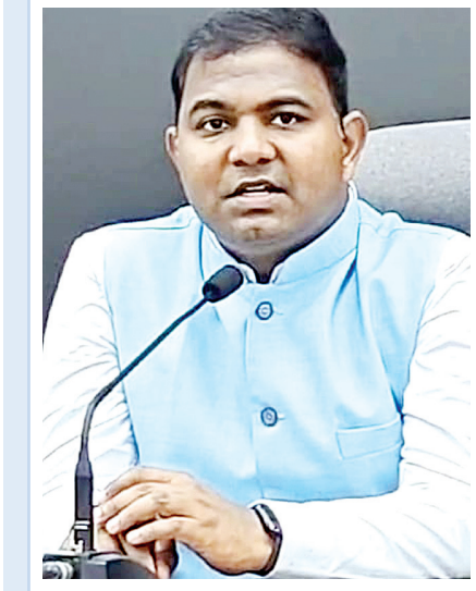
ఫంక్షన్ లో నిషేధిత ప్లాస్టిక్ వినియోగిస్తే