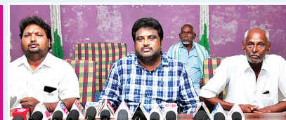
నెల్లూరు కార్పొరేషన్, మేజర్ సూర్యన్ :

నెల్లూరు రూరల్ మండలం ఆమంచర్ల పంచాయతీ మట్టెంపాడు గ్రామం లో సర్వే నెం.3లో జరుగుతున్న భూ కుంభకోణంపై జిల్లా రెవెన్యూ అధికారులు విచారణ చేపట్టి ప్రభుత్వ భూమిని కాపాడాలని, 1983లో 110 దళిత కుటుంబాలకు న్యాయం చేయాలని మట్టెంపాడు గ్రామ రైతులు జిల్లా అధికారులను కోరారు. నెల్లూరు నగరంలోని -మిగతా 2లో