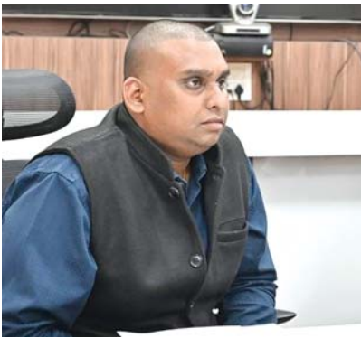
నెల్లూరు కలెక్టరేట్, మేజర్స్ న్యూస్ : జిల్లాలో