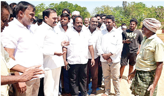
వెంకటాచలం, మేజర్ న్యూస్ :

సోమిరెడ్డి దోపిడీలో హుషార్.. రైతులంటే బేజార్ !