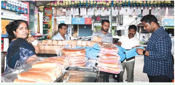
నెల్లూరు కార్పొరేషన్, మేజర్స్వ్యాస్ :

సింగల్ యూజ్ ఫ్లాస్టిక్ వాడకానికి స్పష్టి పలకండి : కమిషనర్ సూర్యతేజ