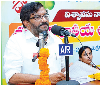
కచ్చితంగా సాధించగలమని తెలిపారు.

వెంకటాచలం మేజర్స్ న్యూస్ : సర్వేపల్లి, తెలుగు భాషాభివృద్ధి, సాహిత్య వికాసానికి మరో అడుగు ముందుకువేసేలా సర్వేపల్లిలో ద్వితీయ జాతీయ కవి సమ్మేళనం అద్భుతంగా సాగింది. ఉగాది పర్వదినాన్ని పురస్కరించుకుని వెంకటాచలంలోని ప్రాచీన తెలుగు విశిష్ట అధ్యయన కేంద్రం ఆధ్వర్యంలో ఈ అద్భుతమైన కవిత్వమహోత్సవం నిర్వహించబడింది. రెండు తెలుగు రాష్ట్రాల నుంచి 200 మందికి పైగా ప్రముఖ కవులు హాజరై, తమ అద్భుత కవిత్వంతో సభను అలరించారు.