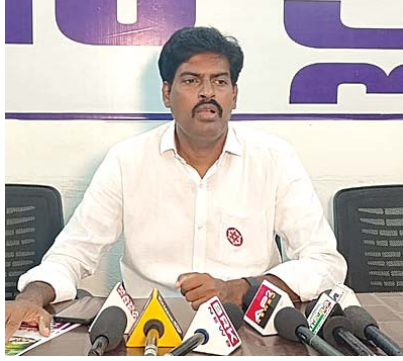
కార్పొరేటర్ కు తక్కువ అన్నారు. పవన్ కళ్యాణ్ గురించి మాట్లాడే అధికారం లేదు జగన్మోహన్ రెడ్డికి లేదని పేర్కొన్నారు.