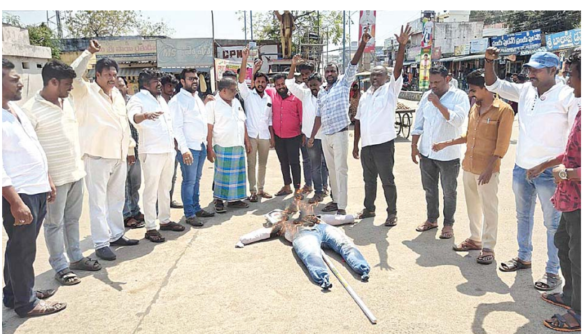
ఆత్మకూరులో మాజీ ముఖ్యమంత్రి జగన్మోహన్ రెడ్డి దిష్టిబొమ్మను దగ్ధం చేస్తున్న జనసేన నాయకులు, కార్యకర్తలు

ఆత్మకూరు, మేజర్స్ న్యూస్ : రాష్ట్ర ఉపముఖ్యమంత్రి, జనసేన వ్యవస్థాపక అధ్యక్షుడు కొణిదెల పవన్ కళ్యాణ్ పై అనుచిత వ్యాఖ్యలు చేస్తూ సహించబోమని ఆత్మకూరు జనసేన నాయకులు పేర్కొన్నారు. మాజీ ముఖ్యమంత్రి జగన్మోహన్ రెడ్డి పవన్ కళ్యాణ్ పై