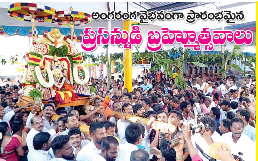
బోగోలు, మేజర్స్ న్యూస్ :

సాక్షాత్ నారద మహాముని కలియుగ ప్రత్యక్ష దైవం శ్రీ ప్రసన్న వెంకటేశ్వర స్వామిని ప్రార్థించిన ప్రాంతం జిల్లాలోని బోగోలు మండలం కొండబిట్లగుంట బిలకోట క్షేత్రం. శ్రీ