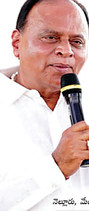
నెల్లూరు, మేజర్స్ న్యూస్ :