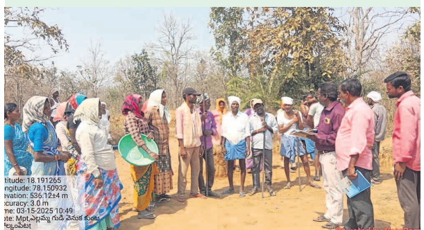
lltude: 18.191265 rgtitude: 78.150932 uration: 53x, 1254 m uration: 3.0 m ne: 03-15-2025 10:49 re: Mpt, పుష్పగిరి, సూర్యులంగంపేట్