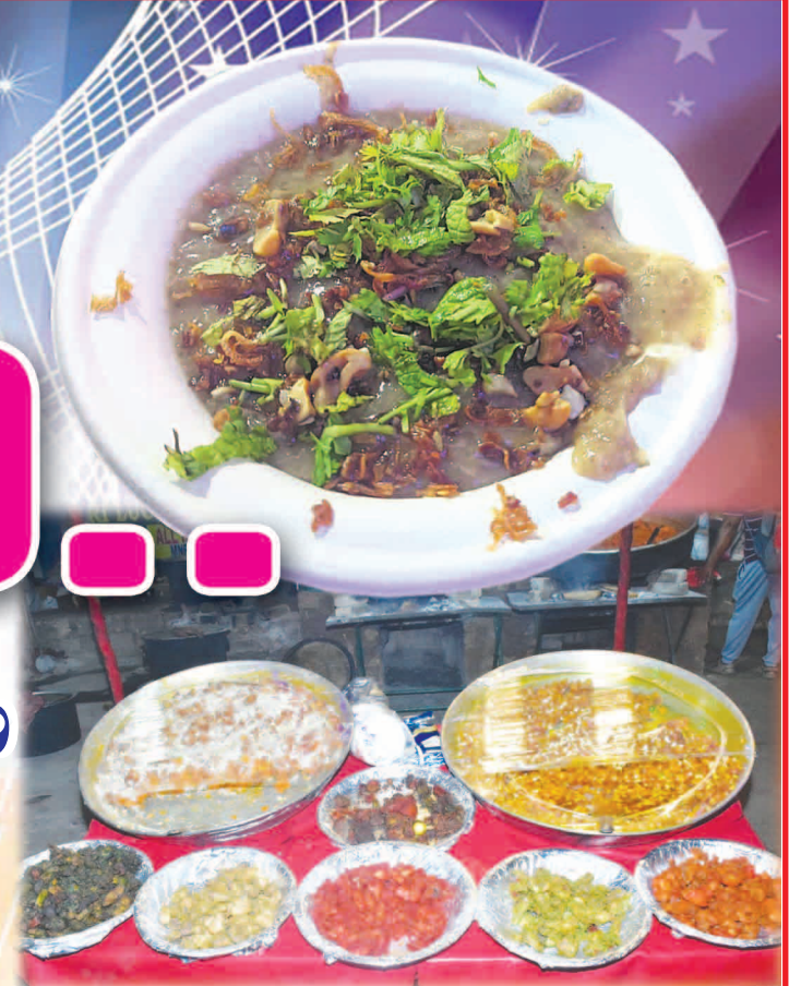
సూర్య నిజామాబాద్ ప్రతినీతి