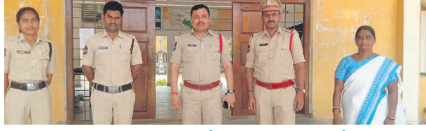
పదవ తరగతి పరీక్షా కేంద్రాలను పరిశీలించిన

ప్రధాన భాగంగా ఉన్నాయని, కానీ భూటాన్ చెప్పిన హ్యూమన్ రిసోర్స్ డే మానవ అభివృద్ధి పర్యవాలను పరిశీలించాలని సూచించడని అభిప్రాయ పడ్డారు. 8 లక్షల జనాభా కలిగిన భూటాన్ దేశం 8 వందల కోట్ల జనాభా కలిగిన ప్రపంచం మానవశక్తి సంతోషంగా జీవించడం ఎలాగో మార్గదర్శనం చేసిందిని కొనియాడారు. బుద్ధిస్ట్ పర్యాటక రంగ అభివృద్ధికి, బుద్ధిజం వ్యాప్తికి బుద్ధిస్ట్ దేశాలు, సంఘాలతో సమన్వయం చేస్తూ కలిసి కృషి చేస్తామని అన్నారు. ప్రతి ఒక్కరం సంతోషంగా ఉండేందుకు కృషి చేయాలని, తమ ప్రాంతంలో తప్పకుండా ఈ హ్యూమన్ రిసోర్స్ డే సదస్సులు నిర్వహించాలని సూచించారు. ప్రపంచంలో మొదటి సారి భూటాన్ లో సదస్సు నిర్వహించుకునే అవకాశం కల్పించిన భూటాన్ రాజుకి, ఇక్కడి సంఘ సంఘాలకు కృతజ్ఞతలు తెలిపారు. వివిధ దేశాల నుంచి 150 మంది ప్రతినిధులు హాజరు అయ్యారు.