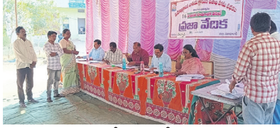
గ్రామాల పంచాయతీ సెక్రటరీ లు, మరియు ఫీల్డ్ అసిస్టెంట్లు టెక్నికల్ అసిస్టెంట్లు కంప్యూటర్ ఆపరేటర్లు పాల్గొన్నారు.