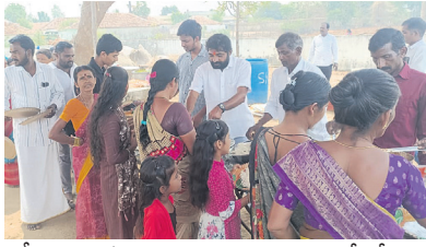
ఎస్సీ మాదిగ సంఘ సభ్యుల ఆధ్వర్యంలో శ్రీ

ఎర్లట్ల: నిజామాబాద్ జిల్లా ఎర్లట్ల మండలంలో ఉగాది పండుగను పురస్కరించుకొని ఎర్లట్ల పోలీమేరలోని భీమన్న దేవాలయం వద్ద స్థానిక చిన్నరేండ్ల, పెద్దరేండ్ల ముదిరాజ్ సంఘ సభ్యుల ఆధ్వర్యంలో అన్నదానము, జాతర నిర్వహించారు. మండలంలోని బట్లూపూర్ గ్రామంలో