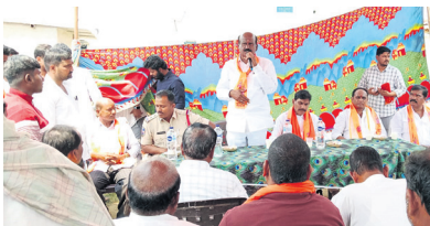
మతాలను వర్గాల వారిని సమాన దృష్టితో చూసాడన్నారు. ఆయన రాజ్యంలో అన్ని వర్గాల వారు సంతోషంగా ఉండేవారు అన్నారు. ఆయనను ఆదర్శంగా తీసుకొని మనందరం నడుచుకోవాలి అన్నారు. గ్రామంలోని