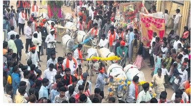
తరలివచ్చి ఎడ్లబండ్ల ప్రదర్శనను తిలకించారు, నల్ల పోచమ్మ అమ్మవారికి ప్రతీక పూజలు చేసి మొక్కులు తీర్చుకున్నారు, అమ్మవారికి

ఉగాది పండుగ పర్యవసానం పురస్కరించుకొని మండల కేంద్రంలోని నల్ల పోచమ్మ ఆలయం చుట్టూ భారీ ఎత్తున ఎడ్లబండ్ల ప్రదర్శన మొదటి రోజు ఆదివారం ఘనంగా నిర్వహించారు, మండల కేంద్రంలో చుట్టుపక్కల గ్రామాలైన, పోచారం, వదలపర్తి, మాల్ తుమ్మెద, చినూర్, వాడి, గోపాల్ పేట్, నాగిరెడ్డిపేట్, లింగంపల్లి, బంజారా తాండ, గ్రామాల నుంచి, ఎడ్ల బండ్లు, తరలివచ్చాయి, ప్రజలు భక్తులు భారీగా