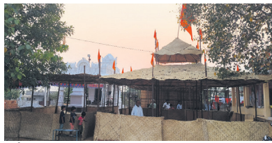
శ్రీసీతారాముల కళ్యాణ మహోత్సవాన్ని వేద పండితుల ఆధ్వర్యంలో కనులపండవగా నిర్వహిస్తారు.