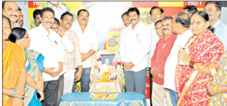
చేస్తుందన్నారు. ఈ కార్యక్రమంలో పట్టణానికి చెందిన ఆర్యవైశ్య సోదరులు, పట్టణ కౌన్సిలర్లు, నాయకులు, మహిళా కార్యకర్తలు పాల్గొన్నారు.