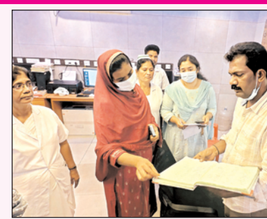
డ్యూటీలో ఉన్న వైద్య సిబ్బంది ఖంగుతింటే, డ్యూటీలో ఉన్న వైద్య సిబ్బంది ఖంగుతింటే,