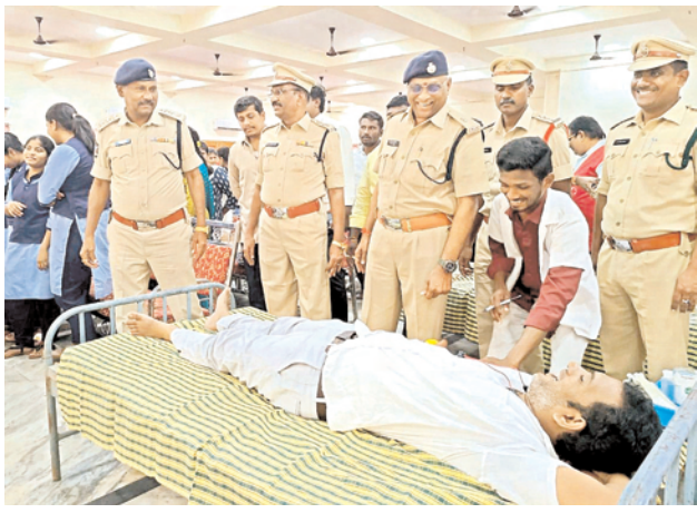
సృష్టికి ఆధారం మహిళ: ఏఎస్సీ విరలేశ్వర్ మహిళా సాధికారత వారోత్సవాల్లో భాగంగా రక్తదాన శిబిరం ప్రతి స్టేషన్లో మహిళల ఫిర్యాదుల స్వీకరణకు ఉమెన్ హెల్ప్ డెస్క్ సఖి పన్ స్టాప్ సెంటర్ సేవలను సద్వినియోగం చేసుకోవాలి