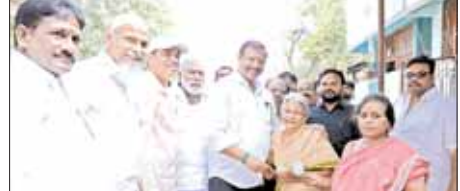
పాలనలో పెన్షన్ను 1000 రూపాయలు పెంచుతానని చెప్పి ప్రజలను నిలుపునా దగా చేసి దానికి ఐదు సంవత్సరాలు సమయం తీసుకున్నారు అని అన్నారు. ఇచ్చిన మాటకు కట్టుబడి త్వరలోనే సూపర్ సిక్స్ పథకాలను అమలు చేస్తామని అన్నారు. ఈ కార్యక్రమంలో తెలుగుదేశం నాయకులు, మున్సిపల్ అధికారులు సిబ్బంది పాల్గొన్నారు.