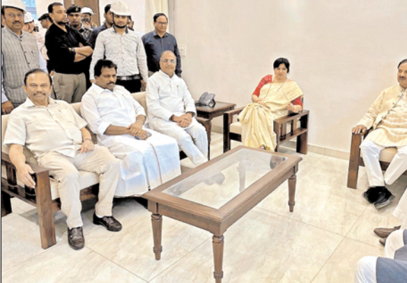
ఆంధ్రప్రదేశ్ ముఖ్యమంత్రి నారా చంద్రబాబునాయుడు ఢిల్లీ పర్యటనలో భాగంగా ఎయిర్పోర్టులో మంగళవారం స్వాగతం పలికిన ఒంగోలు పార్లమెంట్ సభ్యులు మాగుంట శ్రీనివాసులురెడ్డి, ఇతర పార్లమెంట్ సభ్యులు