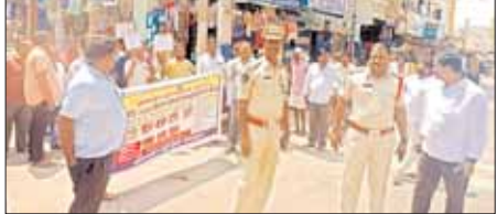
చేసే వారికి బెల్లం సరఫరా చేసిన వారిపై కఠిన చర్యలు తీసుకోబడునని తెలపడం జరిగింది. తదుపరి దోర్నాల గ్రామంలో నాటు సారా నిర్మూలన కొరకు రాష్ట్ర నిర్వహించడం జరిగింది. నాటు సారాయిని మానేయాలని నాటు సార వలన కలుగు నష్టాల గురించి వివరించారు. పూర్తిగా నాటుసారాను రూపుమాపాలని నాటు సారా ఆరోగ్యానికి హానికరమని నాటుసారా వలన కలుగు అనర్థాలను వివరించారు.