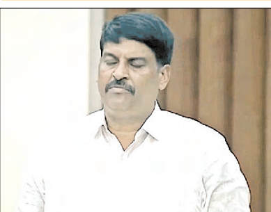
స్టోరేజ్ ట్యాంక్ అవసరం ఉందని విన్నవించారు. కేంద్ర ప్రభుత్వ నిబంధనల ప్రకారం ఒక్క మనిషికి 120 లీటర్లు సరఫరా చేయాలన్నారు నీటి

అసెంబ్లీ సమావేశంలో ఎమ్మెల్యే వేగేశన నరేంద్రవర్మ