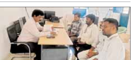
చేతిపంపులు, బోరు బావులు మరమ్మతులు చేపట్టాలని ముఖ్యంగా పారిశుద్ధ్య నిర్వాహణపై దృష్టిపెట్టాలని సిబ్బంది నిర్దేశించి విడనాడాలని సూచించారు. అనంతరం పి4 సర్వే కలెక్టర్ ఆదేశాల మేరకు బుధవారం సాయంత్రానికి 100శాతం సర్వేపూర్తి చేయాలని సూచించారు. ఈ కార్యక్రమంలో ఎంపిడిఓ బ్రహ్మయ్య, సచివాలయాల సిబ్బంది పాల్గొన్నారు.

సి.ఎస్.పురం, మేజర్ న్యూస్: మండలంలోని పెదరాజుపాలెం, కోవలంపాడు సచివాలయాలను మంగళవారం ఎంపిడిఓ ఎల్.బ్రహ్మయ్య ఆకస్మిక తనిఖి చేశారు. ఈ సందర్భంగా సచివాలయాలలో రికార్డులు పరిశీలించి పలుసూచనలు చేశారు. అనంతరం ప్రభుత్వం చేపట్టిన పి4 సర్వేను పర్యవేక్షించారు. ఈ సందర్భంగా ఎంపిడిఓ మాట్లాడుతూ సచివాలయ సిబ్బంది సమయపాటు ఖచ్చితంగా పాటించాలని అదేవిధంగా ప్రభుత్వ లక్ష్యానికి అనుగుణంగా పనిచేసి ప్రజలకు అందుబాటులో ఉండి ప్రజాసమన్వయాలను తెలుసుకుని పరిష్కారానికి కృషి చేయాలని గ్రామాల్లో వేసవి తీవ్రత దృష్ట్యా తాగునీటికి ఇబ్బందులు లేకుండా