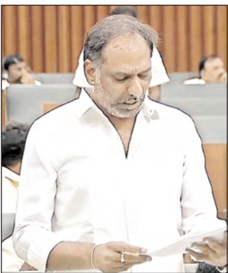
విద్యుత్ ప్లాంట్ ద్వారా సుమారు వెయ్యి మెగావాట్ల విద్యుత్ ఉత్పత్తి జరుగుతుందని వెల్లడించారు.