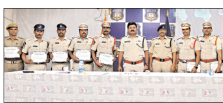
72 ట్రాన్స్ఫారం దొంగతనం కేసులోని ఆరుగురు ముద్దాయిలను అరెస్టు చేయడం లో ప్రతిభ కనబరిచిన

ప్రతిభ కనబర్చిన పోలీసులకు ప్రశంసా పత్రాలు ముండ్లమూరు పోలీస్ స్టేషన్ పరిధిలోని వేమపాడు వద్ద వాహనాలు తనిఖీ చేస్తుండగా నలుగురు వ్యక్తుల వద్ద నాలుగు కేజీల గంజాయి గుర్తించి వారిని అరెస్టు,