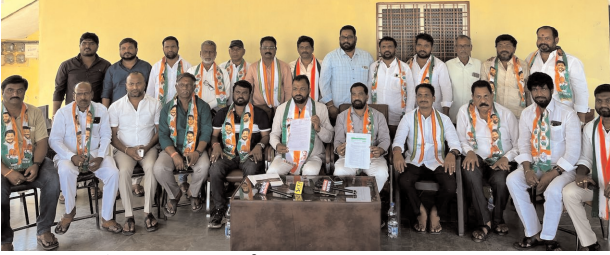
విలేకరుల సమావేశంలో మాట్లాడుతున్న కాంగ్రెస్ నాయకులు