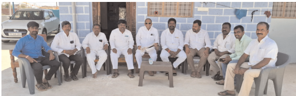
వితేకరుల సమావేశంలో మాట్లాడుతున్న కాంగ్రెస్ నాయకులు.