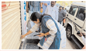
క్లినిక్ను సీజ్ చేస్తున్న దృశ్యం

మేధుల్ జిల్లా ప్రతినిధి, మేజర్ న్యూస్ (మార్చి 19): మేధుల్ మల్కాజిగిరి జిల్లా జగద్గిరిగుట్టలో నకిలీ డాక్టర్ కలకలం రెపాడు. జిల్లా వైద్య ఆరోగ్యశాఖ అధ్యక్షులలో హాసినీ ఫస్ట్ యియర్ క్లినిక్ పై ఆకస్మిక తనిఖీ