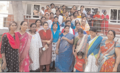
మేడ్చల్ జిల్లా ప్రతినిధి, మేజర్ న్యూస్ (మార్చి, 19) : తెలంగాణ రాష్ట్రంలో ఆశా వర్షం తమ సమస్యల