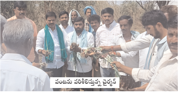
పంటను పరిశీలిస్తున్న చైర్మన్