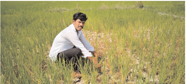
బీటలు వారిన వరి పంటలను చూస్తున్న రైతు