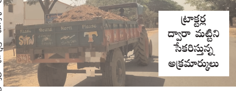
ట్రాక్టర్ల ద్వారా మట్టిని సేకరిస్తున్న అక్రమారులు

ఇటుక బట్టిల యజమానులు తారతమ్యం లేకుండా సమన్వయం చేస్తున్నారు. అందరికీ కాసుల వాటాలు ఇస్తున్నట్లు ఆరోపణలు వినిపిస్తున్నాయి. చిన్న అధికారుల నుండి జిల్లా స్టాఫ్ అధికారుల వరకు వరకు ఎవరికీ ఇవ్వాలని వాటా వారికి ఇస్తున్నట్లు పక్కా సమాచారం. సంబంధిత శాఖ సిబ్బంది నుండి అధికారుల వరకు ముడుపులు మూడుతున్నట్లు తెలుస్తోంది. వాళ్ళు ఎవరు అనేది ముడుపులు తీసుకునే వారికి, ఇచ్చే వారికి మాత్రమే తెలుసు. అందుకే ఇటుకబట్టిల యజమానులు పట్టపగలు ట్రాక్టర్లలో మట్టిని తరలిస్తున్న పాలకులు కానీ, అధికారులు కానీ పట్టించుకోకపోవడం వల్ల ప్రజలకు వస్తున్న అసమానాలు నిజమనిపిస్తోంది.