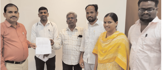
శనివారం వికారాబాద్ లో అడిషనల్ కలెక్టర్ ను కలసి కోటపల్లి ప్రాజెక్టు నీరు వదులాలని తెలియచేస్తున్న రైతన్నలు పెద్దేముల్ , మేజర్ న్యూస్ (మార్చి 15):

పెద్దేముల్ మండల కొండాపూర్ చెరువులో తగ్గిన నీటి మట్టం సంతోషంగా సాగుచేసుకోవచ్చని సంతోషించారు. వరి నాటిన రెండు నెలలకే కొండాపూర్ చెరువులో భారీగ నీరు 80శాతం వరకు తగ్గడంతో రైతన్నలు ఏమి చేయాలన్న ఆలోచనలో పడ్డారు. తమకు కోటపల్లి చెరువు నీరు తప్ప మరో మార్గం లేదని రైతులు ఆందోళన వ్యక్తం చేస్తున్నారు. ఈ చెరువు కింద వ్యవసాయ బోరులు కూడ లేవు. ఉన్న సాగు భూమి చెరువు కింద ఉంది. గతంలో కూడ చెరువు తుము వద్ద గండి పడి నీరు వృధా పోవడంతో అప్పట్లో జిల్లా కలెక్టర్ వెంటనే స్పందించి ఇరిగేషన్ , రెవెన్యూ అధికారులతో మరమ్మత్తులు చేయించారు. ప్రస్తుతం కొండాపూర్ చెరువులో నీరు తగ్గి వరి పంటలు బీటలు వారి ఎండి పోతున్నా మండల అధికారులు కనీసం కన్నెత్తి చూడక పోవడం ఎంత వరకు న్యాయమని రైతులు మండి పడుతున్నారు. అన్నదాతకు కష్టాలు ఎదురవుతున్నా ఇంతకు మండలంలో రెవెన్యూ , ఇరిగేషన్ అధికారులు ఉన్నారా ? లేరా అని రైతన్నలు ప్రశ్నిస్తున్నారు. వెంటనే జిల్లా కలెక్టర్ స్పందించి కోటపల్లి ప్రధాన కాలువలకు గండ్లు పడి అధ్యాసంగా మారడంతో నీరు వచ్చే ఆస్కారం లేదని వెంటనే ఇరిగేషన్ అధికారులు యంత్రాలతో గండ్లను మూసి నీరు వదులాలని కోరుతున్నారు. వరి పంటలు ఎండక ముందే నీరు వచ్చే ప్రభుత్వం చర్యలు తీసుకోవాలని రైతులు కోరుతున్నారు. సకాలంలో కోటపల్లి ప్రాజెక్టు నీరు అందకపోతే అటు వరి పంటలు సాగు చేసిన రైతులతో పాటు ఇటు కౌలు రైతులకు కూడ ఇబ్బందులు తప్పవని ఆవేధన వ్యక్తం చేస్తున్నారు.