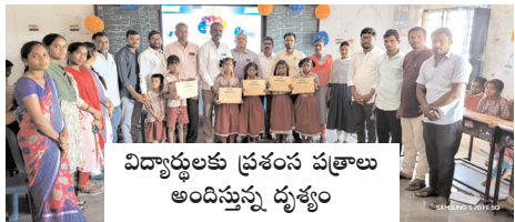
విద్యార్థులకు ప్రశంస పత్రాలు అందిస్తున్న దృశ్యం