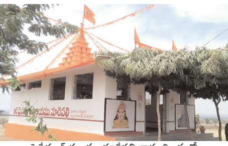
పెద్దేముల్ మండల మారేపల్లి గ్రామ శివారులో వెలసిన ఆర్య మైసమ్మ దేవాలయం

పెద్దేముల్, మేజర్ న్యూస్(మార్చి 15): నేడు (ఆదివారం) పెద్దేముల్ మండల మారేపల్లి గ్రామ శివారులోని మిని ఆర్యమైసమ్మ జాతర నిర్వహించడం జరుగుతుందని గ్రామ ప్రజలు శనివారం ఓ ప్రకటనలో తెలిపారు. ఉదయం 5 గంటలకు అమ్మ వారికి అభిషేకం , 11-00లకు అన్నధానం, సాయంత్రం 4గంటలకు అమ్మ వారికి బోనాలు తీయడం జరుగుతుందన్నారు. అందుకు మండల ప్రజలు పెద్ద సంఖ్యలో పాల్గొని అమ్మ వారి జాతరను విజయవంతం చేయాలని కోరారు. ప్రతి ఏటా