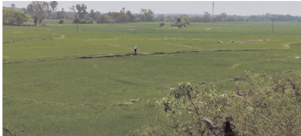
కొండాపూర్ పెద్ద చెరువుల కింత రైతన్నలు సాగు చేసిన వరి పంటలు