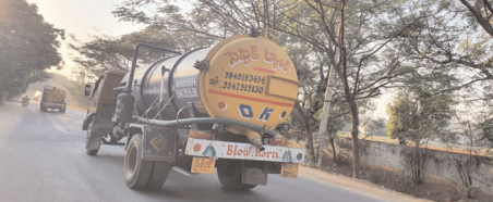
పారిశ్రామిక వ్యర్థ జలాలతో రోడ్డుపైన వెళ్తున్న సెప్టిక్ ట్యాంక్ వాహనాలు

మొదటిపేజీ తరువాయి... టీఎన్12 యూబి7946, టీఎన్12 యూబి7022 అనే సంబంధ గల సెప్టిక్ ట్యాంక్ వాహనాలు పారిశ్రామిక వ్యర్థ జలాలతో నిత్యం తిరుగుతూ ఉన్నాయి. సెప్టిక్ ట్యాంకుల్లో ఉన్నటువంటి వ్యర్థ పదార్థాలను ఎవరైనా తొలగించుకోవాల్సిందే కానీ ఇంతవరకు బాగానే ఉన్నప్పటికీ క్షీనింగ్ కోసం రావల్సిన ట్యాంకర్ల నిర్వాహకులు పారిశ్రామిక వ్యర్థ జలాలను వదిలేస్తున్నారు. పూడూరు, రాజబోల్లారం గ్రామ శివారు ప్రాంతాల్లో ఎక్కువగా జరుగుతుంది. సాగునీటి కాలవలు ఎక్కడైతే ఉంటాయో అక్కడ సెప్టిక్ ట్యాంక్ వాహనాలు నిలిపి వాహనంలో ఉన్న