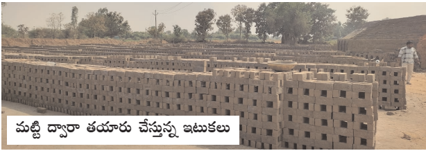
మట్టి ద్వారా తయారు చేస్తున్న ఇటుకలు

చెరువులను తోడేస్తూ మట్టిని స్టాక్ పెట్టుకుంటున్న ఇటుక వ్యాపారులు యధేచ్ఛగా మట్టి తరలించి సామ్మి చేసుకుంటున్న అక్రమారులు అధికారులతో రహస్య మంతనాలు.. బేరాసారాలు కుదిరాకే పనులు వేగవంతం ఏడాదికి ఒకసారి నామమాత్రంగా రసీదులేని రుసుం .. గుట్టలు గుట్టలుగా మట్టి నిల్వలు అక్రమ మైనింగ్ను అరికట్టాలంటున్న ప్రజలు కుల్చుర్ల రూరల్, మేజర్ స్ట్రాస్ (మార్చి 15): చెరువుల మట్టిని తోడేసి తరలించేందుకు ఇటుకబట్టి ల నిర్వాహకులకు ఎలాంటి అనుమతులు లేవు. అయినా సరే బట్టిల యజమానులది ఇష్టారాజ్యమై పోయింది. కనీసం సంబంధిత అధికారుల అనుమతి తీసుకోవాలన్న ఆలోచన కూడా ఇటుక బట్టి నిర్వాహకులకు రావడం లేదు. చెరువులను తవ్వకోవడానికి ఇటుక బట్టి వారికి ఎవరు అనుమతిచ్చారన్నది జగమెరిగిన రహస్యం. వేసవికాలంలో చెరువులు ఎండిపోగానే ఇటుక బట్టి యజమానులు ఒక్కసారిగా లేచి కూర్చుంటున్నారు. మట్టిని ఎలా తవ్వకోవాలని పథకాలు వేస్తారు. ఇందుకోసం ఎవరిని ఆశ్రయించాలి? వారిని ఆశ్రయించి వారికి ముట్ట చెప్పాల్సిన, ముడుపులు ముట్ట చెప్పి యదేచ్ఛగా జెసిబి లు పెట్టి చెరువులను అందరికీ కాసుల వాటాలు:-చెరువుల మట్టిని తవ్వకుంటున్నారు.