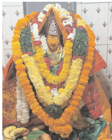
పూజలు అందుకుంటున్న అమ్మ వారు.

పెద్దేముల్, మేజర్ న్యూస్(మార్చి 15): నేడు (ఆదివారం) పెద్దేముల్ మండల మారేపల్లి గ్రామ శివారులోని మిని ఆర్యమైసమ్మ జాతర నిర్వహించడం జరుగుతుందని గ్రామ ప్రజలు శనివారం ఓ ప్రకటనలో తెలిపారు. ఉదయం 5 గంటలకు అమ్మ వారికి అభిషేకం , 11-00లకు అన్నధానం, సాయంత్రం 4గంటలకు అమ్మ వారికి బోనాలు తీయడం జరుగుతుందన్నారు. అందుకు మండల ప్రజలు పెద్ద సంఖ్యలో పాల్గొని అమ్మ వారి జాతరను విజయవంతం చేయాలని కోరారు. ప్రతి ఏటా