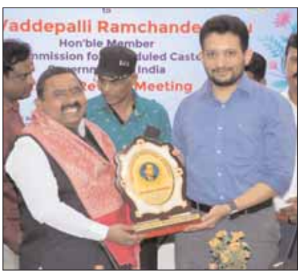
కేంద్ర, రాష్ట్ర ప్రభుత్వాలు అందించే పథకాలను ఎస్సీ, ఎస్టీ వర్గ ప్రజలు ఉపయోగించుకునేందుకు అవగాహన కార్యక్రమాలు నిర్వహించాలని సూచించారు. మహిళలకు అందించే సబ్సిడీ రుణాల గురించి అవగాహన కల్పించడంతో పాటు పారదర్శకత పాటించాలని, స్వయం ఉపాధి కోసం చిన్న, కుటీర పరిశ్రమలను ప్రోత్సహించాలని చెప్పారు.

మొదటిపేజీ తరువాయి... సమావేశంలో ఆయన పాల్గొని, అనంతరం మీడియాతో మాట్లాడుతూ, అధికారులకు గట్టి హెచ్చరికలు జారీ చేశారు. 46 నెలలుగా సబ్సిడీ రుణాలపై నిర్లక్ష్యం శాసనసభ నియోజకవర్గాల్లో ఎస్సీ, ఎస్టీలకు అందించాల్సిన సబ్సిడీ రుణాలపై గత 46 నెలలుగా తీవ్ర నిర్లక్ష్యం కొనసాగుతోందని రామచందర్ మండిపడ్డారు. రుణాల మంజూరులో జాప్యం వల్ల లబ్ధిదారులు నాన్-పర్మామెన్స్ అకౌంట్స్, సిబిల్ సమస్యలు ఎదుర్కొంటున్నారని ఆయన ఆందోళన వ్యక్తం చేశారు. ఈ విషయంలో రాష్ట్ర ప్రభుత్వం తక్షణమే స్పందించి చర్యలు తీసుకోవాలని, భవిష్యత్తులో రుణాలు క్రమం తప్పకుండా అందేలా చూడాలని అధికారులను ఆదేశించారు. కేంద్ర ప్రభుత్వ కఠిన సూచనలు అణగారిన వర్గాల అభివృద్ధి కోసం ప్రధానమంత్రి నరేంద్ర మోడీ కృషి చేస్తున్నప్పటికీ, రాష్ట్ర స్థాయిలో అమలులో లోపాలు కనిపిస్తున్నాయని రామచందర్ వ్యాఖ్యానించారు. కేంద్రం అందించే పథకాలను సరైన విధంగా అమలు చేయకపోతే కఠిన చర్యలు తప్పవని హెచ్చరించారు. హరిజనులు, గిరిజనులతో ఆడుకోవద్దని ప్రభుత్వాన్ని హెచ్చరించారు. ఎస్సీ, ఎస్టీ సమస్యలపై సమగ్ర సమీక్ష ఈ సమావేశంలో ఎస్సీ, ఎస్టీల భూ సమస్యలు, ఉపాధి అవకాశాలు, విద్య, పౌష్టికాహారం, హాస్టళ్ల నిర్వహణ తదితర అంశాలపై సమగ్రంగా చర్చించారు. పోస్ట్ మెట్రిక్ స్కాలర్షిప్ లబ్ధిదారుల సంఖ్య, ఫీజు భర్తీ అలస్యమైతే విద్యార్థులకు ఇబ్బందులు రాకుండా తగిన చర్యలు తీసుకోవాలని అధికారులను ఆదేశించారు. పథకాలకు అవగాహన కల్పించాలి