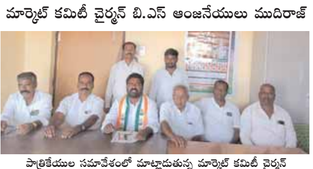
పాత్రికేయుల సమావేశంలో మాట్లాడుతున్న మార్కెట్ కమిటీ చైర్మన్