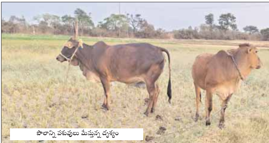
శాలాన్ని పశువులు మేస్తున్న దృశ్యం

చౌడాపూర్, మేజర్ న్యూస్ (మార్చి 18): ఆరుగాలం కష్టపడి సాగు చేసిన పంటలు కండ్ల ముందే ఎండుతుంటే రైతులు కన్నీటి పర్యంతమవుతున్నారు. సాగునీరు లేక దిక్కుతోచని స్థితిలో రైతులు