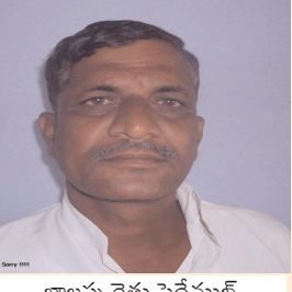
బాలప్ప రైతు పెద్దేముల్.

గత ఏడాదికి పోలిస్తే ఈ ఏడాది ఉల్లి పంట దిగుబడి ఘనంగా తగ్గింది. పెట్టుబడులు మాత్రం రెండింతలు పెరిగాయి. గతంలో ఉల్లి గింజలు రూ.300 నుండి రూ.400 కిలో అందుబాటులో ఉండేది. నేడు రూ.500 నుండి రూ.800లకు కిలో పలకిన నాణ్యమైన విత్తనాలు దొరకడం లేదు. ప్రభుత్వం ఉల్లి రైతులకు సబ్సిడీ పు నాణ్యమైన విత్తనాలు పంపిని చేయాలి. అంతేగాకుండా పంటకు గిట్టు బాటు ధరలు కూడ కల్పించాలి. అప్పుడే రైతుకు సరైన న్యాయం జరుగుతుంది.