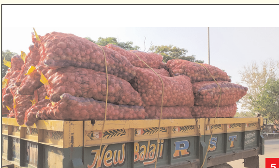
ట్రాక్టర్ల ద్వారా మార్కెట్కు తరలిస్తున్న రైతులు