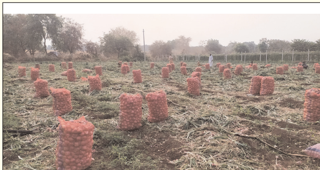
మార్కెట్కు సంచలనం నింపి సిద్ధం చేస్తున్న రైతులు.

▶▶ గత రెండేళ్లుగా రూ.600 నుండి రూ.1200 క్వింటాళ్లు విక్రయాలు ▶▶ నేడు మార్కెట్లో రూ.2500 నుండి రూ.2800 అమ్మకాలు ▶▶ మార్కెట్ లేక హైద్రాబాద్ మలకేపేటకు తరలింపు