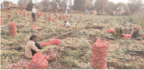
పెద్దేముల్ మండలంలో పండించిన పంటను శుద్ధి చేస్తున్న కులీలు.

▶ గత రెండేళ్లుగా రూ.600 నుండి రూ.1200 క్వింటాళ్లు విక్రయాలు ▶ నేడు మార్కెట్లో రూ.2500 నుండి రూ.2800 అమ్మకాలు ▶ మార్కెట్ లేక హైద్రాబాద్ మలకేపేటకు తరలింపు