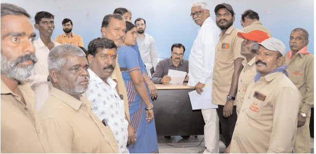
అదనపు కలెక్టర్ కు వినతి పత్రం అందజేస్తున్న పంచాయతీ కార్మికులు మొదటిపేజీ తరువాయి... అనంతరం ప్రజావాణి కార్యక్రమంలో జిల్లా అదనపు కలెక్టర్ కు వినతిపత్రం సమర్పించారు. జీతాలు లేక పేదరికంలో కార్మిక కుటుంబాలు ఈ కార్మికులు ఊరికి ఊరు పారిశుద్ధ్యం కాపాడుతూ, ప్రజలకు సేవలందిస్తూ, తెల్లవారజాము నుంచే క్రమిస్తారు. కానీ, నాలుగు నెలలుగా ఒక్క

రూపాయి జీతం కూడా అందక సర్వం కోల్పోతున్నారు. బడికి వెళ్లే పిల్లల ఫీజులు కట్టలేక ఇంటికి పరిమితమవుతున్నారు. కొంతమంది కార్మికులు వైద్య ఖర్చులను భరించలేక తీవ్ర అనారోగ్య పరిస్థితుల్లో బతుకుబండ్లిని లాగుతున్నారు. రెండు పూటల భోజనం కూడా పెట్టలేకపోతున్నారా? ఇంటి యజమానులు అద్దె కోసం ఒత్తిడి చేస్తున్నారా? మా పరిస్థితిని చూడటానికి ఎవరూ లేరా? అని ఆవేదన వ్యక్తం చేశారు ఓ మహిళా కార్మికురాలు.