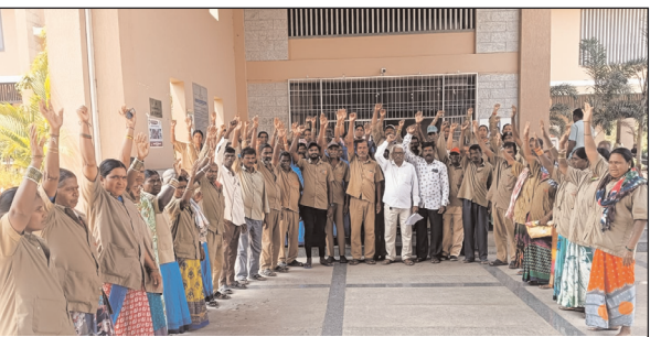
కలెక్టరేట్ ముందు నిరసన తెలుపుతున్న దృశ్యం.

రోజూ కష్టపడి పనిచేస్తాం? కానీ జీతం రావటం లేదు. పిల్లల చదువులు ఆగిపోయాయి? ఇంటి అద్దె కట్టలేక గదిలోంచి బయటకు పంపిస్తున్నారు. బడికి వెళ్లేని పిల్లల కళ్ళలో ప్రశ్నలు? జోబనం పెట్టలేక తల్లిదండ్రుల మనసులో వేదన?? ఇదీ గ్రామపంచాయతీ కార్మికుల అసహాయ స్థితి!