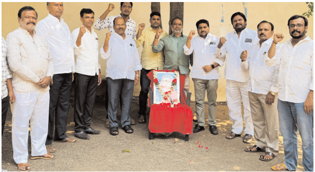
సావిత్రి బాయి పూలే చిత్రవహినికి పూలమాలలు వేసి నివాళ్ళ అర్పిస్తున్న ప్రతినిధులు

వికారాబాద్, మేజర్ న్యూస్ (మార్చి 10): విద్యకు నోచుకోక వివక్షకు గురవుతున్న సమాజంలో దేశంలోనే మొట్టమొదటి మహిళా పాఠశాలను నెలకొల్పి మహిళలకు విద్యను అందజేసిన మొదటి మహిళా ఉపాధ్యాయురాలు స్వర్ణీయ సావిత్రి