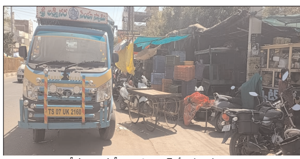
రోడ్డుపై అడ్డగోలుగా పార్కింగ్ చేసిన వాహనాలు