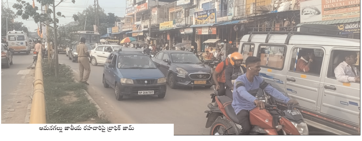
ఆమనగల్లు జాతీయ రహదారిపై ట్రాఫిక్ జామ్

ఆమనగల్లు, మేజర్ న్యూస్ (మార్చి 10) ఆమనగల్లు పట్టణంలోని శ్రీశైలం హైదరాబాద్ జాతీయ రహదారి పై చిరు వ్యాపారులు యదేచ్ఛగా ఆక్రమణలకు పాల్పడుతున్న పట్టించుకోనే నాధుడు లేడని ప్రయాణికులు, వాహనదారులు వాపోతున్నారు. మిగతా 2లో