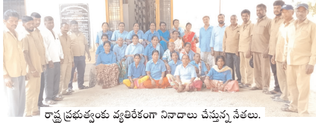
రాష్ట్ర ప్రభుత్వం వ్యతిరేకంగా నినాదాలు చేస్తున్న నేతలు.