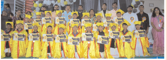
సావిత్రి బాయి పులే ఆశయ సాధనకు కృషి చేద్దాం