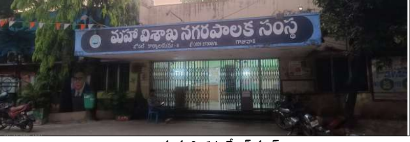
గాజువాక, మార్చి 14, మేజర్ స్టూన్స్

-వాటాలు పంచుకుంటున్న టి బి బి టి.-వార్డులు పంచుకుంటూ దోచుకుంటున్న వైసె-సచివాలయం ప్లానింగ్ సెక్టరీ తో చేతులు కలిపిన టి పి బి టి