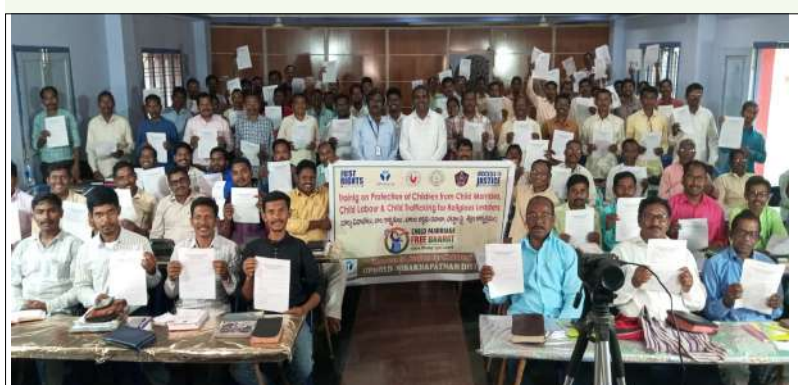
శ్రీకాకుళం, మార్చి 14, మేజర్ స్టూన్స్:-