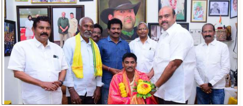
బొబ్బిలి మార్చి 14: మేజర్ స్టూన్స్:-

- పెంట జెడ్పీ హైస్కూల్ హెడ్కాంప్లెక్స్ చింత రమణ ని సన్మానించిన ఎమ్మెల్యే శ్రీ బేజినాయన: