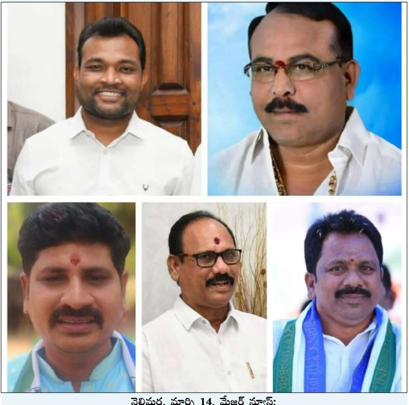
నెల్లిమర్ల, మార్చి 14, మేజర్ స్టాన్స్: