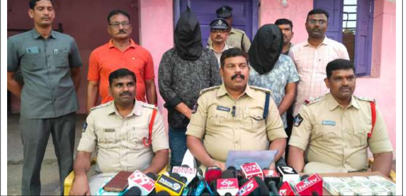
పాలకొండ, మేజర్ స్టూన్స్

ఏటియం ల లో డబ్బులు తీయడానికి సహాయం చేస్తున్నట్లు సదీస్తూ మోసం చేస్తున్న మూడు సు పట్టుకున్నట్లు డిపీసీ ఎం. రాంబాబు తెలిపారు. శుక్రవారం పోలీస్ స్టేషన్ లో ఆయన విలేకరుల తో మాట్లాడారు.వడమ కు చెందిన సవరపు తామస్ ఇప్పటికీ విశాఖ మేరకు ఈ కేసు నమోదు చేసామన్నారు. తన ఎటియం కార్డు నుంచి డబ్బులు తీయడానికి ఎన్ బి ఐ మెయిన్ ట్రాంక్ ఎటియం కు వెళ్ళి, వరుసలో నిలబడి బ్యాలన్స్ చెక్ చేస్తుండగా, అక్కడే లైన్ లో ఉన్న వ్యక్తి తనకు సహాయం చేస్తున్నట్లు సదీచి, అతని ఎటియం ను మార్చి వేసి, అదే కలర్ కల్లిన్ ఎటియం ను ఇప్పివేసి, కంప్యూటర్ ఎటియం ను వ్యయంగాంచి దఫా దఫాలుగా డబ్బులు విత్ డ్రా చేస్తూన్నారని వీళ్ళు ఇద్దరు వస్తారు, ఎక్కడ ఏటియం బెక్కిల్ ఇష్యుట్లు ఉంటాయో వాటిని ఎంచుకొని, ఒకరు ఎటియం బయట నిల్చునివుండి, ఇంకొకరు మాత్రం లైన్ లో నిల్చుని, లైన్ లో ఉన్న వాళ్ళకి సహాయం చేస్తున్నట్లు చేస్తూ, ఎటియం ట్రాన్సాక్షన్ చేస్తున్నప్పుడు సహాయం చేస్తున్నట్లు సదీచి వెనుకనుండి వాళ్ళ యొక్క ఎటియం పిన్ ను అల్టర్స్ చేసి, కార్డు బయటకి వచ్చే సమయం లో, కార్డు మీద డబ్బు క్షీన్ చేస్తున్నట్లు సదీచి, వీళ్ళ దగ్గర అదే తరహాలో ఉన్న వేరే కార్డు (ఫిక్) కార్డును వాళ్ళకి ఇచ్చి, అక్కడ నుండి చరార్లై, ఆ ఎటియం కార్డు ఉపయోగించి అమ్మోట్ విన్లార్ చేస్తూ ఉంటారు. మొత్తం అమ్మోట్ కార్డు లో అయిపోయిన తరువాత ఆ కార్డు ను ఇంకొకరికి మారుస్తూ అఫ్సెస్ ను కొనసాగిస్తారు.4,10,000 నగదు, స్వీట్స్ కారు, రెండు సెల్ ఫోన్ లు, 78 ఫేక్ ఎటియం కార్డులు స్వాధీనం చేసుకున్నామని తెలిపారు.ఈ కేసు చేదించిన సిబి మజ్జి చంద్రమౌళి, ఎస్సీ ప్రయోగ మార్చి, రాజేష్, నారాయణ లను ఆయన అభినందించారు. ఈ విలేకరుల సహాయంతో సిబి మజ్జి చంద్రమౌళి, ఎస్సీ ప్రయోగమూర్తి, సిబ్బంది పాల్గొన్నారు.