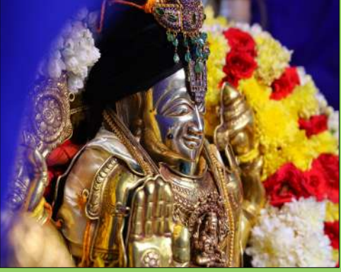
విశాఖపట్నం, మార్చి 14, మేజర్ స్టూన్

సింహాద్రి అప్పన్న కి పెళ్లి కుదిరింది. సోదరుడు వరాహ సరసింహాది కి తన కుమార్తె శ్రీ మహాలక్ష్మి నిచ్చి వివాహం చేయడానికి పైడితల్లిమ్మ వారు అంగీకారం తెలిపారు. విశ్వవసు నామ సంవత్సరం చైత్ర శుద్ధ ఏకాదశి ఏప్రిల్ 8న కళ్యాణం చేయడానికి ముహూర్తాన్ని ఖరారు చేశారు. చైత్ర శుద్ధ పౌర్ణమి తెలుగు సంవత్సరాది ఉగాది మార్చి 30 నాడు పెళ్లి రాట వేడుక జరిపించాలని నిర్ణయించారు. కన్నుల పండుగ డోలోత్సవాన్ని అప్పన్న ఆలయ వార్షికోత్సవాలలో భాగంగా పూర్ణిమ రోజున డోలోత్సవం నిర్వహించడం ఆసనవాయిదీ... ఈ ఉత్సవాన్ని గ్రామీణులు బొడ్డెనదుగు పున్నమిగా వ్యవహరిస్తారు. స్వామి వారికి తిరుకల్యాణోత్సవం శుక్రవారం గ్రామదేవత పైడితల్లిమ్మ కుమార్తె పూర్ణిమ రోజున నిర్వహించడం చేసుకుంటాడని