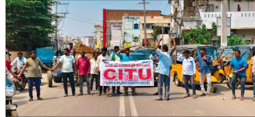
బొమ్మిల, మార్చి 14: మేజర్ స్వయం:

-స్టీల్ ప్లాంట్ కు గనులు నిర్వహణకు నిధులు ఇవ్వాలి: సిఐటియు