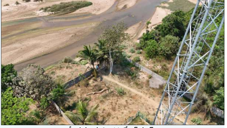
శ్రీకాకుళం, మార్చి 14, మేజర్ స్వయం