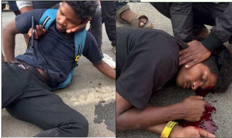
దుండ్రిగుడ, మార్చి 14, మేజర్ స్టూన్స్:-