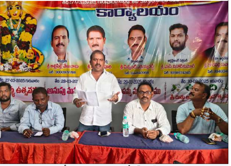
భీమునిపట్నం, మార్చి 14, మేజర్ స్వయం :