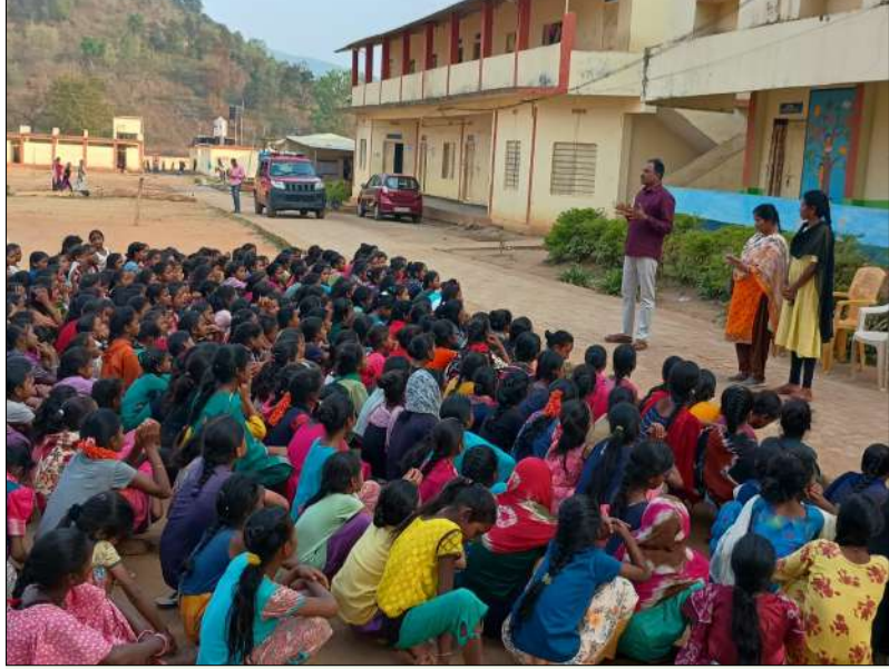
దుండ్రిగుడ, మార్చి 14 మేజర్ స్టూన్స్:-

పది పరీక్షలకు భయాన్ని వీడి ఆత్మస్థైర్యంతో ముందుకెళ్లాలని అరకు సీబి హిమగిరి విద్యార్థులను ఆకాంక్షించారు. మండల కేంద్రంలోని ప్రభుత్వ ఉన్నత, బాలబడి గిరిజన ఆశ్రమం, బాలికల పాఠశాలలను తనిఖీ వారితో ముప్పవించారు. పరీక్ష కేంద్రాల్లో ఏర్పాటు చేసిన సౌకర్యాలపై పరిశీలించిన ఆయన మాన్ కాపీయింగ్ కు తావులేకుండా చూడాలని ఉపాధ్యాయ సిబ్బందికి సూచించారు. అనంతరం ఆయా పాఠశాల విద్యార్థులతో మాట్లాడారు. పాఠశాల స్థాయిలోనే ఉన్నత చదువులకు అన్యాయం ఉంటుందని, పది పరీక్షలను నిర్ణయంగా హాజరై మంచి ఫలితాలను సాధించాలన్నారు. బాలికల ఆశ్రమ పాఠశాల విద్యార్థినిలకు గంజాయి, మద్యం ద్రవ్యాలను, సైబర్ క్రిం నేరాలపై అవగాహన కల్పించారు. పోలీసు సిబ్బంది తదితరల పాల్గొన్నారు.