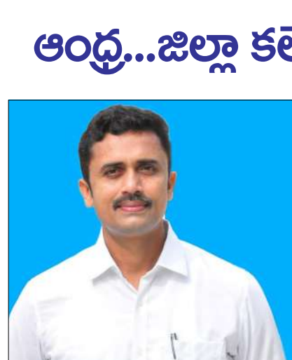
పార్వతీపురం, మార్చి 14 (మేజర్ స్టాన్స్):