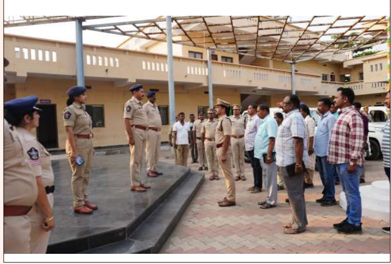
(మొదటి పేజీ నుంచి)

ఉపి ప్రారంభించారు. ఈ సందర్భంగా ఎస్సీ మాట్లాడుతూ శక్తి ఏర్పాటు అవగాహన పెంపొందించాలని రాష్ట్ర ప్రభుత్వాలవలె మేరకు మహిళలపై జరుగుతున్న దాడుల నియంత్రణ దీని యొక్క ముఖ్య ఉద్దేశం అన్నారు. ప్రతి స్త్రీ ధైర్యంగా ఉండాలని ఈ ఆకాశం అయిన స్త్రీల పట్ల అగ్రంగా మాట్లాడిన ప్రవర్తించిన తగిన ప్రతిఫలం క్షణమైన ఉంటుందిని హెచ్చరించారు ప్రతి ఒక్కరికి 112/100 నెంబర్ పై అవగాహన పెంచాలని శక్తి ఆఫ్ ది వస్త్రీ ప్రతి ఫోన్ కాలర్ కు క్షణాల పైన అక్కడికి శక్తి బృందాలు చేరుకొని అప్రమత్తమై మహిళలపై దాడులు జరగకుండా చూస్తాయన్నారు. జిల్లాలో కొత్తగా ఏర్పాటు చేసిన శక్తి టీమ్లకు అయినా దిశా నిర్దేశం చేశారు.