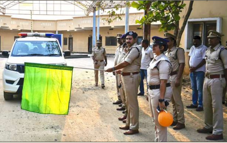
పార్వతీపురం రూరల్ మార్చి 14 (మేజర్ స్టూన్):

శక్తి టీం తో ఆకతాయిలకు చెక్..! - వాహనాలను ప్రారంభించిన జిల్లా ఎస్పీ