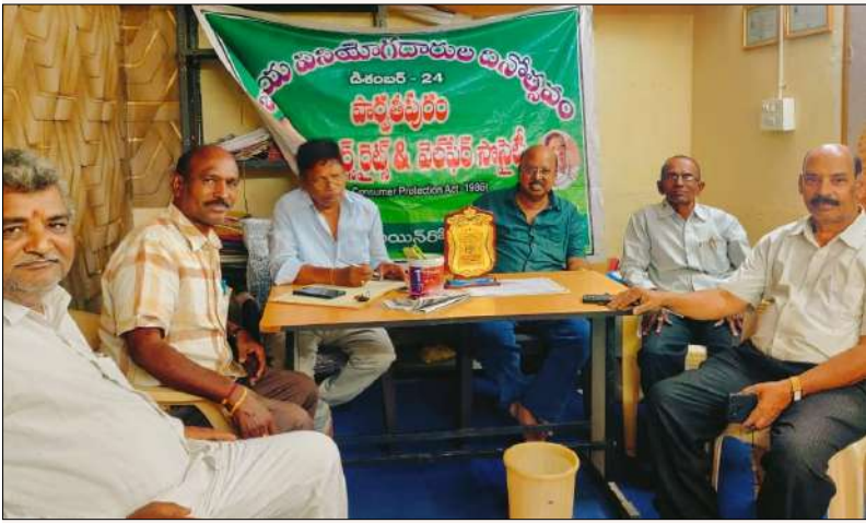
గరుగుబిల్లి, మార్చి 14, మేజర్ స్టాన్స్: