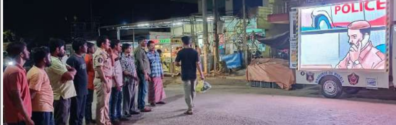
గొలుగొండ మార్చి 13 మేజర్ స్టూన్స్