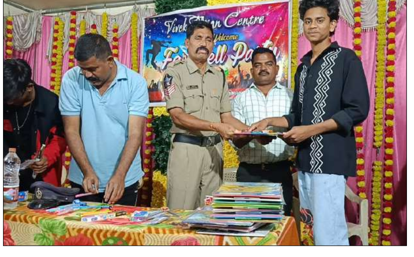
పార్వతీపురం, మార్చి 14, మేజర్ స్వయం :