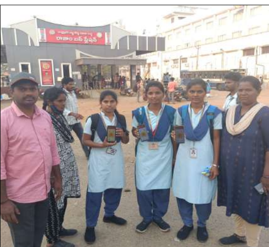
విజయనగరం లైమ్, మార్చి 14, మేజర్ స్టూన్: