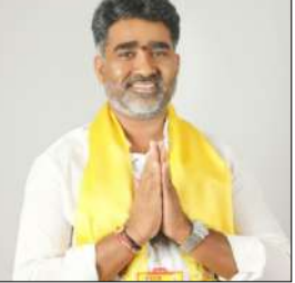
శ్రీకాకుళం, మార్చి 14, మేజర్ స్టూన్స్:-

శ్రీకాకుళం నియోజకవర్గ ఎమ్మెల్యే శంకర్ విశాఖ ఏ కాలనీలో ఆఫీసులో ఉదయం 9 గంటల నుండి అందుబాటులో ఉంటారని పార్టీ కార్యాలయం ఒక ప్రకటనలో తెలియజేసింది. శ్రీకాకుళం పట్టణం, గార, శ్రీకాకుళం రూరల్ మండలంలోని ప్రజా సమస్యలు ఏవైనా ఉంటే వాటిని తమ దృష్టికి తీసుకువస్తే, పరిశీలించి, పరిష్కారానికి తగు చర్యలు చేపడతామని, ఈ ప్రజా గ్రీవెన్స్ అందరు వినియోగించుకోవాలని ఎమ్మెల్యే గొండు శంకర్ తెలియజేశారు