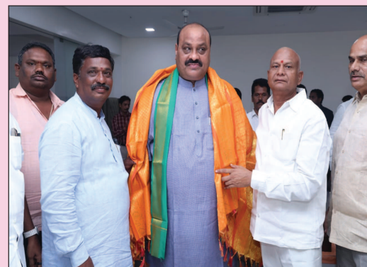
సందిగామ, మార్చి 26, మేజర్ స్కూల్స్