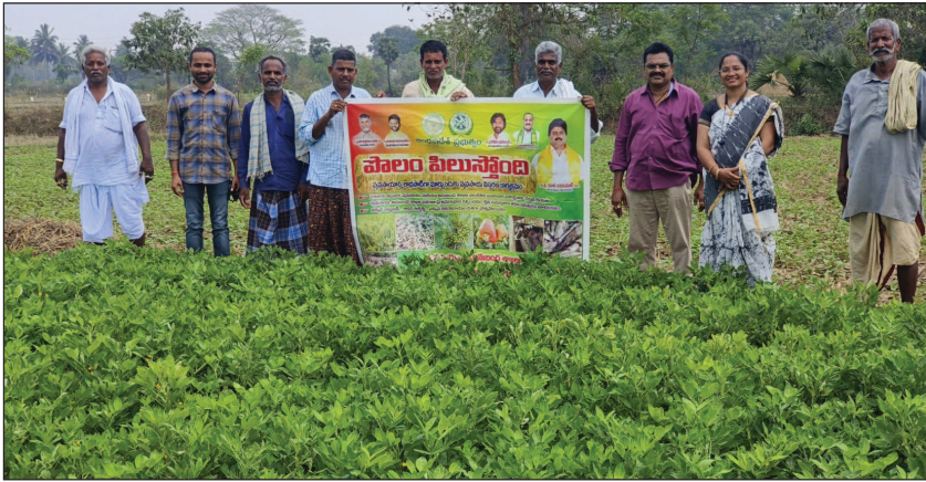
అమదాలవలస రూరల్, మార్చి 26, మేజర్ స్కూల్స్

- వంజంగి, తోటాడ గ్రామాల్లో పొలం పిలుస్తుంది