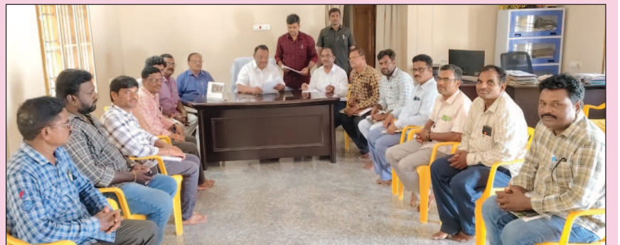
పోలాకి, మార్చి 26, మేజర్ స్కూల్స్

ఇల్లు లేని ప్రతి ఒక్కరికి వకా గృహం మంజూరు చేయాలని ఎమ్మెల్యే బగ్గు రమణమూర్తి అన్నారు. పోలాకి మండలం లోని కత్తిరివాసిపేట క్యాంపు కార్యాలయంలో గృహనిర్మాణ శాఖ అధికారులతో సమీక్షా సమావేశం నిర్వహించారు. ఈ సమావేశంలో ఎమ్మెల్యే నియోజకవర్గంలో చేపడుతున్న గృహనిర్మాణ పనులపై ఆరాతీశారు. అనంతరం ఎమ్మెల్యే మాట్లాడుతూ గృహ నిర్మాణ పనులు వేగవంతం కావాలని నిర్మాణ పనుల్లో ఏమైనా సమస్యలు ఉంటే తెలియజేస్తే పరిష్కారానికి చర్యలు చేపట్టడం జరుగుతుందని, అర్బులైన ప్రతి ఒక్కరు ఇల్లు కలిగి ఉండాలని, అదే కూటమి ప్రభుత్వం లక్ష్యమన్నారు. పీఎంఎఫ్ అర్బన్, పీఎంఎఫ్ గ్రామీణ పథకాలకు చెందిన బిసి, ఎస్సీ, ఎస్టీ లబ్ధిదారులకు అదనపు సాయం కింద నిర్మాణంలో ఉన్న గృహాలకు 50000, 75000 మరియు లక్ష రూపాయలు అందించిన ముఖ్యమంత్రి నారా చంద్రబాబు నాయుడుకి కృతజ్ఞతలు తెలిపారు. డిమాండ్ సర్వే ఎంట్రి ఈ నెల ఆఖరుతో ముగుస్తున్నందున అర్బులైన లబ్ధిదారులందరూ ఆన్లైన్లో నమోదు చేయుటకు సర్వే వేగవంతం చేయాలని గృహ నిర్మాణ శాఖ అధికారులను ఆదేశించారు. ఈ కార్యక్రమంలో గృహ నిర్మాణ శాఖ డీఈ, నాలుగు మండలాల ఏఈలు, వర్క్ ఇన్స్పెక్టర్లు తదితరులు పాల్గొన్నారు.