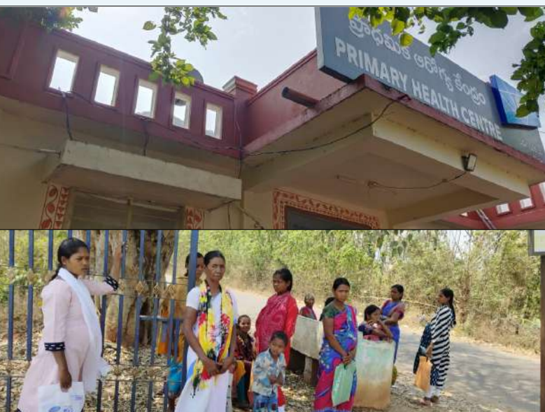
పార్వతీపురం రూరల్ మార్చి 10 (మేజర్ స్టూన్):

మండలంలోని డోకినీల ప్రాథమిక ఆరోగ్య కేంద్రంలో నెలవారి పరీక్షల కోసం వచ్చిన గర్భిణీలకు అవస్థలు తప్పడం లేదు. సమయానికి పీపెచ్చిలో వైద్యురాలు అందుబాటులో లేకపోవడంతో నిండు గర్భిణీలు ఎండలో వైద్యురాలి కోసం ఎదురుచూపులు పరిస్థితి నెలకొంది.