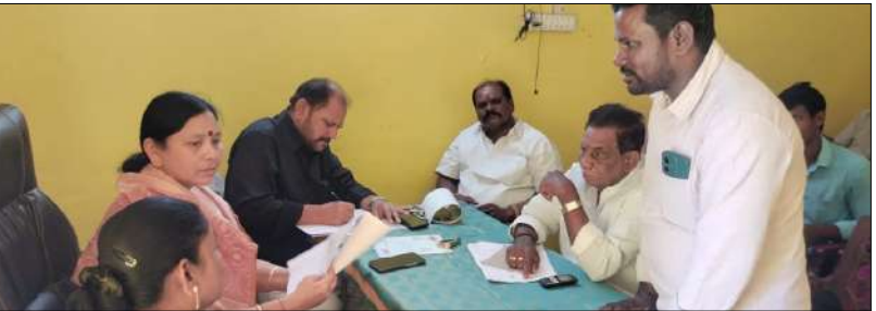
పాలకొండ, మేజర్ స్టూన్