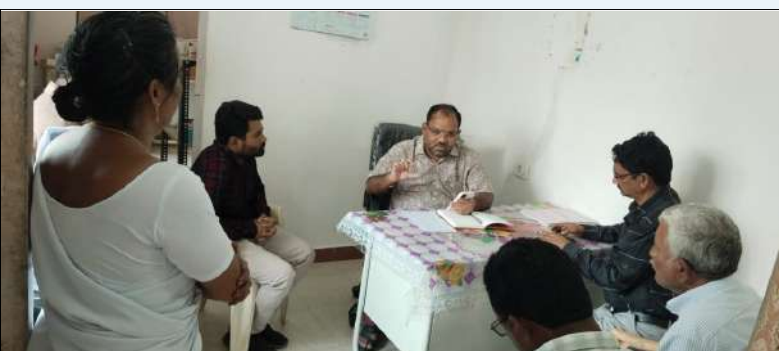
పార్వతీపురం రూరల్ మార్చి 10 ( మేజర్ స్టూన్):

-తాళ్ల బురిడీలో పర్యటించిన వైద్య బృందం -వైద్య శిబిరంతో పరీక్షలు