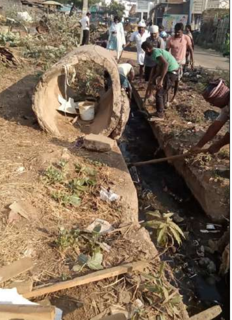
పార్వతీపురం రూరల్ మార్చి 10 (మేజర్ స్టూన్):

మండలంలోని సంఘం వలస పంచాయితీ సీతంపేట గిరిజన గ్రామంలో దావకర్తిపై ఇటీవల “సూర్య దినపత్రిక” ప్రచురించిన కథనానికి అధికార యంత్రాంగం కదిలింది.