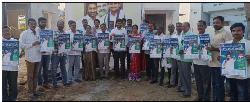
అమదాలవలస, మార్చి 10, మేజర్ స్టూన్