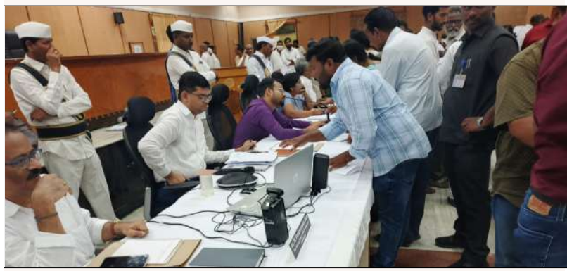
కోతూరు మార్చి 10 (మేజర్ స్టూన్ )

-జిల్లా కలెక్టర్ కు మెట్టూరు కు చెందిన వ్యక్తి పిర్యాదు.