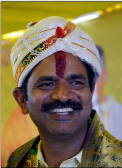
గుడ్డుకుంటే, పోనీలే పార్టీకోసం తెగ కష్టపడ్డాడు ఇన్నాళ్ళకు ఓ పదవివాదయ్యాడు అని అంతా