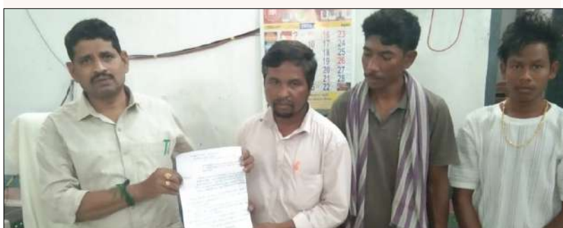
పాలకొండ, మేజర్ స్టూన్