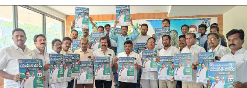
పార్వతీపురం, మార్చి 10, మేజర్ స్టూన్ :

-నిరుద్యోగ యువత,తల్లి దండ్రులు పాల్గొని విజయవంతం చేయాలి.