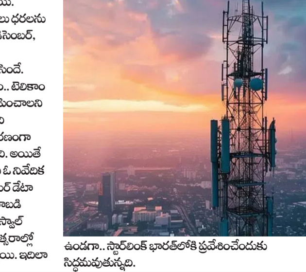
ఉండగా.. స్టార్ లింక్ భారత్ లోకి ప్రవేశించేందుకు సిద్ధమవుతున్నది.

మొబైల్ రీచార్జ్ ధరలు ప్రయం కానున్నాయి. భవిష్యత్ లో కంపెనీలు టాలిఫ్ ధరలు పరుగులు పెంచునున్నాయి. ఆదాయాన్ని మెరుగుపరుచుకునేందుకు కంపెనీలు ధరలను సవరించనున్నాయి. కంపెనీలు ఇప్పటికే 2021 డిసెంబర్, 2021 నవంబర్ తో పాటు పాటు 2024 జులైలో మూడుసార్లు టాలిఫ్ లను పెంచిన విషయం తెలిసిందే. సెంట్రమ్ ఇన్ స్ట్రీట్ న్యూస్ లో లిస్ట్ నివేదిక ప్రకారం.. టెలికాం కంపెనీలు యావరేట్ రెవెన్యూ పర్ యూజర్ ను పెంచాలని యోచిస్తున్నాయి. ధరల పెరుగుదల చాలా మంది యూజర్లపై భారం పడనున్నది. అధిక చార్జీల కారణంగా కంపెనీలకు ఆదాయం మరింత సమకూరునున్నది. అయితే టెలికాం రంగం ప్రస్తుతం క్లిష్టమైన దశలో ఉందని ఓ నివేదిక పేర్కొంది. పోటీ తీవ్రత తగ్గిందని.. పెట్టుబడి, కస్టమర్ డేటా వినియోగాన్ని పరిగణించి తీసుకుంటే ఇండస్ట్రీ రాబిట్ ఇప్పటికీ చాలా తక్కువగా ఉందని మోటోలాల్ ఓస్కాల్ గతంలో చెప్పింది. ఈ క్రమంలో రాబోయే సంవత్సరాల్లో కంపెనీలు టాలిఫ్ ధరలను మరింత పెంచునున్నాయి. ఇదిలా