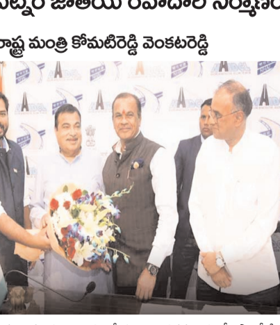
విజయవాడ నుంచి మచిలీపట్నం వరకు మరో ప్యాకేజీగా విభజించి బిందర్ల పిలవాలని అధికారులను గడ్కరీ అభిప్రాయించారు. 62 కి.మీ మేర శ్రేణిలం ఎలీవేటెడ్ కాండాను సంబంధించి ప్రత్యేక సమావేశం ఏర్పాటు చేసి చర్చిస్తామని కేంద్ర మంత్రి చెప్పారు అని మంత్రి కోమటిరెడ్డి తెలిపారు.

తెలంగాణ బ్యూరోప్రతినిధి: రిజిస్టర్ రింగ్స్ (ఆర్ఆర్ఆర్)కు సంబంధించిన అన్ని అనుమతులు రెండు నెలల్లో ఇస్తామని, అన్ని కీసురెన్సును పచ్చాక ప్రధాన ద్వారా పుష్కల తీసుకోవాలని కేంద్ర మంత్రి నితీష్ గడ్కరీ హామీ ఇచ్చారని రాష్ట్ర మంత్రి కోమటిరెడ్డి వెంకటరెడ్డి తెలిపారు. రిజిస్టర్ రింగ్స్, హైవే కోసం గడ్కరీతో సమావేశం అనంతరం ఆయన మీడియాతో మాట్లాడారు. సంగారెడ్డి - భువనగిరి - చౌటప్పల్ వరకు ఆర్ఆర్ఆర్ బిందర్ల పత్రీయం పూర్తయింది. దాదాపు 95శాతం భూ సేకరణ కూడా పూర్తయింది. రూ. వెయ్యి కోట్లతో 12 ఆర్ఆర్ఆర్ కూడా మంజూరు చేశారు. హైదరాబాద్ - విజయవాడ జాతీయ రహదారి ఆరు లైన్ నిర్మాణం ప్రారంభించిన పూర్తి చేసేందుకు చర్యలు తీసుకోవాలని గడ్కరీ అభిప్రాయించారు. హైదరాబాద్ నుంచి మచిలీపట్నం వరకు రోడ్డు విస్తరణ ఆలస్యంపడుతున్నందున.. గుడిమత్తూర్ల నుంచి విజయవాడ వరకు ఒక ప్యాకేజీ,