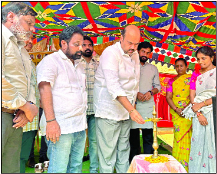
బొబ్బిలి, మార్చి 29: మేజర్ స్టూన్స్:

- 372 మంది అభ్యర్థులకు ఉద్యోగ అవకాశం కల్పన జ్యోతి ప్రజ్వలన చేసిన ఎమ్మెల్యే బేబినాయన