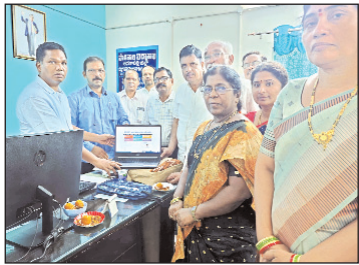
అనకాపల్లి, మార్చి 29, మేజర్ స్టూస్: