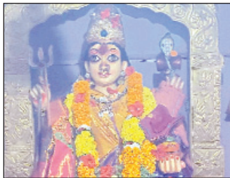
లక్ష్మవరపుకోట మార్చి 29 మేజర్ స్టాఫ్:

ఎల్ కోట మండల కేంద్రం లోని జామి వీధి లో గల శ్రీ నూకాలమ్మ తల్లి తీర్థము శనివారం వైభవంగా నిర్వహించారు ఈ సందర్భంగా అమ్మవారికి ఉదయం నుంచి ప్రత్యేక పూజలు నిర్వహించగా మహిళలు పసుపుకుంకుమలతో అమ్మవారిని పూజించి వారి మొక్కులు తీర్చుకున్నారు మధ్యాహ్నం భారీ అన్నసమారాధన ఏర్పాటు చేసారు సాయంత్రం అమ్మవారి ఘంటాల ఊరేగింపు మేక తాళాలతో వైభవంగా నిర్వహించగా సాయంత్రం సాంగీత నాటకము ప్రదర్శించారు