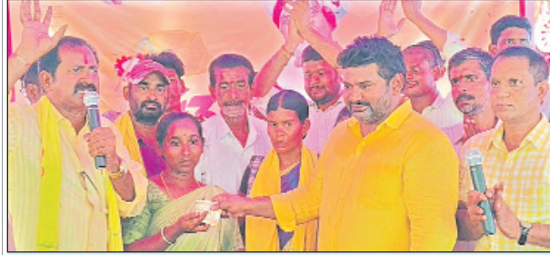
పార్వతీపురం రూరల్ మార్చి 29 (మేజర్ స్టూన్):

-బాధిత కుటుంబాలకు ఆర్థిక సహాయం -ఘనంగా పార్టీ ఆవిర్భావ దినోత్సవం