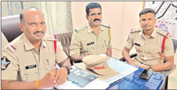
రామభద్రపురం మేజర్ స్టాఫ్