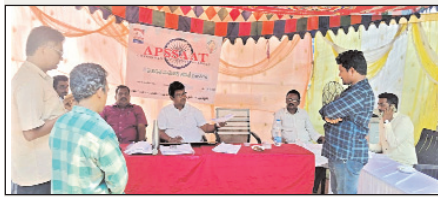
పార్వతిపురం రూరల్ మార్చి 29 ( మేజర్ సూన్ ):

-గ్రీతులకి పరిమితమైన మొక్కలు -వేతనాలు ఓకే... సంతకాలు నో -ఉపాధి హామీలు అక్రమాలు చూసి ఆశ్చర్యం...-ఫీల్డ్ అసిస్టెంట్ల జీతాలు నిలుపుదల..