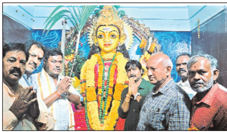
గాజువాక, మార్చి 29, మేజర్ స్టూన్

జీవీఎంసీ 74వ వార్డు దయాల్ నగర్ క్వార్టర్ రోడ్లో ఉన్న