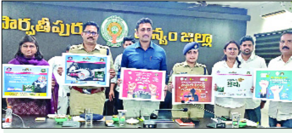
పార్వతీపురం, మార్చి 29, మేజర్ స్టూన్స్ :