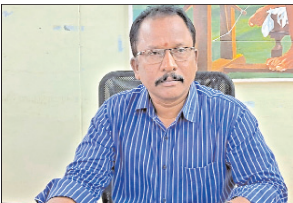
పాలకొండ, మేజర్ సూన్

ఈ నెల 30, 31 నెలవరోజులైనప్పటికీ ఆంధ్రప్రదేశ్ ప్రభుత్వం వారి ఉత్తర్వుల మేరకు రేపు మరియు ఎల్లండి నగర పంచాయతీలో క్యాష్ కౌంటర్లు ఉదయం 6 గం. నుండి రాత్రి 9 గం. వరకు తెరిచే ఉంటాయని కమీషనర్ జయరాం తెలిపారు. కాపున ప్రజలు ఈ అపురూప అవకాశాన్ని వినియోగించుకోవాలన్నారు. 2024-25 ఆర్థిక సంవత్సరం వరకు చెల్లించాల్సిన ఆస్తి పన్ను (ఇంటి పన్ను, ఖాళీస్థలం పన్ను) బకాయిలను ఏకమొత్తంగా ఒకేసారి చెల్లించినట్లయితే చెల్లించాల్సిన వడ్డీలో 50% రాయితీని పొందవచ్చన్నారు. ఈ నెలఖర లోగా భాగీగా ఉన్న ఇంటి పన్నులను, కుకాయి పన్నులు, ఖాళీ స్థలం పన్నులు చెల్లించని వక్రములో ఆన్లైన్ లో ఏప్రిల్ 1 వ తేదీ నుండి చేర్చబడిన అదనపు వడ్డీతో సహా చెల్లించవలసి వస్తుందని కనుక ప్రజలు వెంటనే కుకాయి పన్నులు, నీటి పన్నులు, ఖాళీ స్థలం పన్నులు మొదలగునవి ఈ నెలఖర లోగా మీ వద్దకు వచ్చే సచివాలయ సిబ్బందికి గానీ లేదా నగర పంచాయతీలో ఉన్న కలెక్షన్ కౌంటర్ లో గానీ చెల్లించి తగు రశీదు పొందవలసినదిగాను తద్వారా పాలకొండ నగర పంచాయతీ అభివృద్ధిలో భాగస్వాములు కావాలని ప్రజలకు