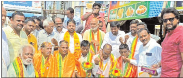
పాలకొండ, మేజర్ స్టూన్

-జెండా ఆవిష్కరించి మిఠాయిలు పంచుకున్న కార్యకర్తలు - సీనియర్ కార్యకర్తలకు ఘనసన్మానం