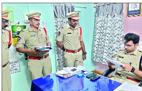
అనకాపల్లి, మార్చి 29 మేజర్ స్టాన్స్: