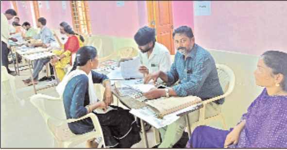
పూసపాటిరేగ, మార్చి 29, మేజర్ స్టూన్:

మండల పరిషత్ కార్యాలయంలో బీసీ రుణాల ఇంటర్వ్యూలు శనివారంతో ముగిసాయి. శుక్రవారం నుంచి రెండు రోజులు పాటు కొనసాగిన ఇంటర్వ్యూలకు మండలంలోని పెరుగు ఎనిమిది పంచాయతీలకు చెందిన పందలదిమంది దరఖాస్తులు చేసుకున్నారు. ఇంటర్వ్యూలకు కుల ధ్రువీకరణ పత్రాలతో పాటు ఆదాయ ధ్రువీకరణ పత్రాలు కూడా అవసరమని అధికార సిబ్బంది చెప్పడంతో పలువురు ఆగమేగాల మీద మీసేవ కేంద్రాలకు వెళ్లి మరి దరఖాస్తు చేసుకోవలసిన పరిస్థితి ఏర్పడింది. అధిక సంఖ్యలో అభ్యర్థులు రావడంతో మండల పరిషత్ కార్యాలయం కిత్కితలు ఆడింది. దరఖాస్తుల స్కూటీ కార్యక్రమంలో బీసీ కార్పొరేషన్ కి చెందిన అధికార సిబ్బందితో పాటు సచివాల సిబ్బంది, పలు బ్యాంకులకు చెందిన అధికారులు హాజరయ్యారు.