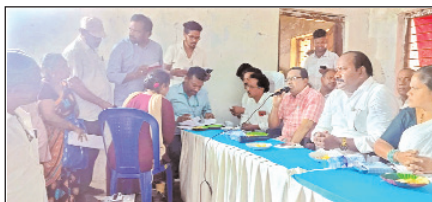
నెల్లిపల్లె, మార్చి 28, మేజర్ స్టూస్: