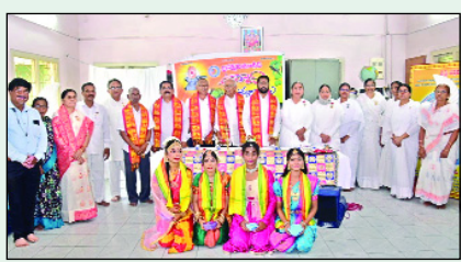
అక్కయ్యపాలెం. మార్చి 29 మేజర్ స్టాన్స్