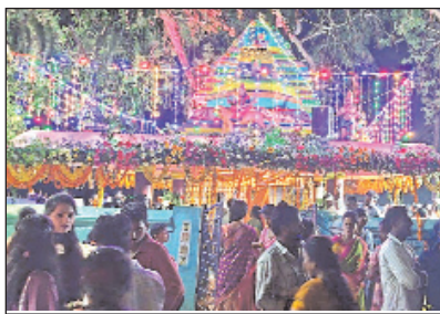
బుచ్చయ్యపేట, మార్చి 29, మేజర్ స్టూన్:-

- ప్రత్యేకంగా ఆకట్టుకున్న జిల్లా స్థాయి కోలాటం ప్రదర్శన పోటీలు