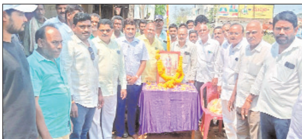
రామభద్రపురం మేజర్ స్టూస్