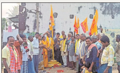
సీతానగరం మార్చి 29 మేజర్ స్టూన్.

మండలంలో పలు గ్రామాలలో తెలుగుదేశం పార్టీ 43వ ఆవిర్భావ దినోత్సవ వేడుకలు నిర్వహించారు. ఈ సందర్భంగా పార్టీ జెండాను ఎగురవేసి, కేక్ కట్ చేసి స్వీట్లు పంచిపెట్టారు. జోహార్ ఎన్టీఆర్ అంటూ నినాదాలు చేశారు. ఈ కార్యక్రమంలో ఆయా గ్రామాల సర్పంచులు నాయకులు, కార్యకర్తలు తదితరులు పాల్గొన్నారు.