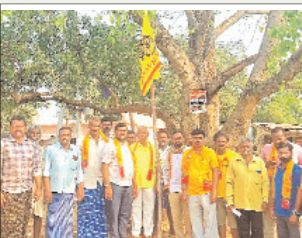
లక్ష్మవరపుకోట మార్చి 29 మేజర్ స్టాఫ్: