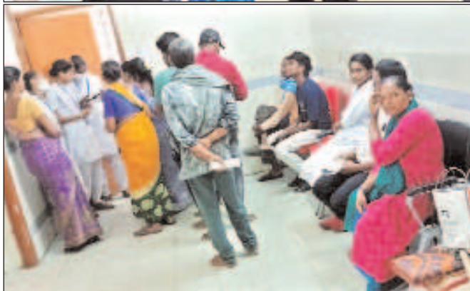
పార్వతీపురం, మార్చి 28, మేజర్ స్కూల్ :