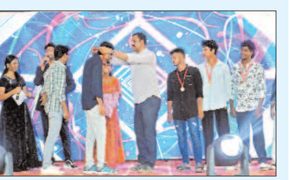
నెల్లిపల్లె, మార్చి 28, మేజర్ స్టూస్: