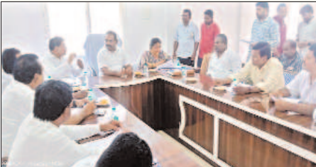
నరసన్నపేట మార్చి 28 మేజర్ సూన్స్ :

నరసన్నపేట మేజర్ పంచాయతీ సాధారణ సభలో సభ్యుల డిమాండ్