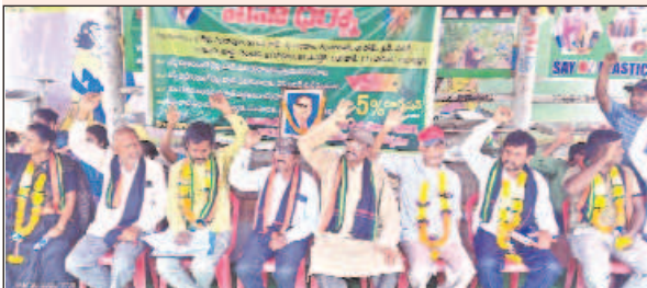
విజయనగరం టౌన్ , మార్చి 28 , మేజర్ స్టూస్ :