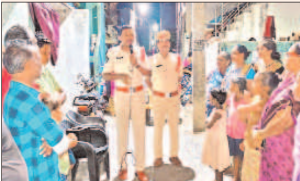
నెల్లిమర్ల, మార్చి 28, మేజర్ న్యూస్:

-భోగాపురం రూరల్ సిబి రామకృష్ణ-నెల్లిమర్ల నగర పంచాయతీలో పల్లెనిద్ర