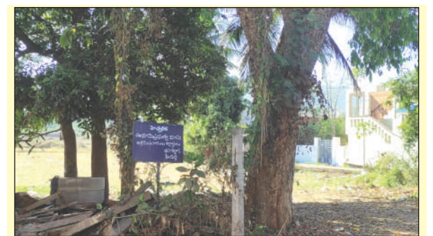
గాజువాక, మార్చి 28

,మేజర్ స్టూన్: జీవీఎంసీ 88 వార్డు కోటనరవ గ్రామం లో కోట పైడిమాంబ కాలనీ లో పార్క్ స్థలంను సోషల్ వెల్ఫేర్ గతంలో రైతుల భూమి కొనుగోలు చేసి పేదలకు పట్టా రూపంలో ఇచ్చారు. ఆనాటి ఆ స్థలంలో ప్రభుత్వం ఇచ్చిన లేఅవుట్ లో ఉన్న పార్క్ స్థలాన్ని బోర్డు మాత్రమే కనబడుతుంది స్థలం వ్యవసాయ భూమిగా వైసీపీ చోట నాయకుడు మార్చుకున్నారు.