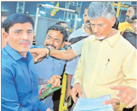
శ్రీకాకుళం, మార్చి 28, మేజర్ సూన్స్