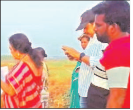
గరుగుబిల్లి, మార్చి 28, మేజర్ స్యూస్: