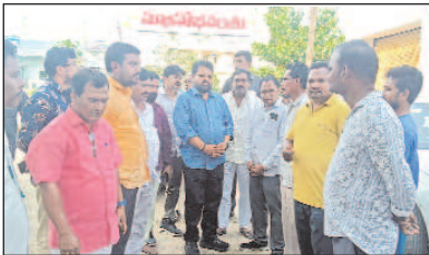
సీతంపేట మార్చి 28 మేజర్ న్యూస్