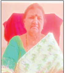
సీతంపేట మార్చి 28 మేజర్ న్యూస్