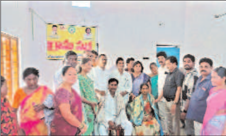
బొబ్బిలి, మార్చి 28: మేజర్ స్వ్యాన్:

- పకృతి వ్యవసాయం చేసిన రైతులు కు సన్మానం: