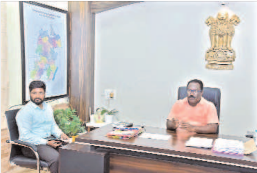
విజయనగరం బ్యారో, మార్చి 28, మేజర్ న్యూస్ :