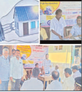
మెరకముడిదాం మార్చి 28 మేజర్ స్టూస్.

- వినియోగదారుల పాలిట వరం: ఏపిఈపీడీసీఎల్ ఏ.ఈ: దివాకర్!