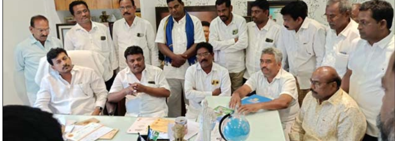
పార్టీ ప్రారంభం, మార్చి 8, మేజర్ న్యూస్ :-