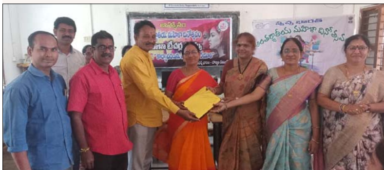
బొబ్బిలి మార్చి 8: మేజర్ స్వస్తి: