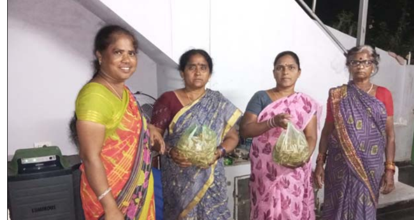
సీతానగరం 8, మేజర్ న్యూస్:

మండల వెలుగు అధ్యక్షులలో వివోపల ద్వారా పసుపు విక్రయించేందుకు ప్రభుత్వ ఆదేశాల మేరకు ఏర్పాటు చేసినట్లు మండల వెలుగు ఏపీఎం శ్రీరాములు తెలిపారు ఈ మేరకు ఆయన మాట్లాడుతూ పాడేరు, అరకూ, తదితర ప్రాంతాల్లో పండించిన పసుపును గ్రామపంచాయతీల్లోని వివోపల ద్వారా విక్రయించేలా వెలుగు అధికారులకు బాధ్యతను అప్పగించినట్లు, దీంతో శనివారం మండల కేంద్రంలోని వెలుగు కార్యాలయంకు పసుపు ఉన్నతాధికారులు పంపించడం జరిగిందని గ్రామాల్లోని వివోపల ద్వారా పసుపును విక్రయించడం జరుగుతుందని ఇప్పటికే కొన్ని గ్రామాలలో విక్రయాలు జరుగుతున్నాయని ఆయన తెలిపారు