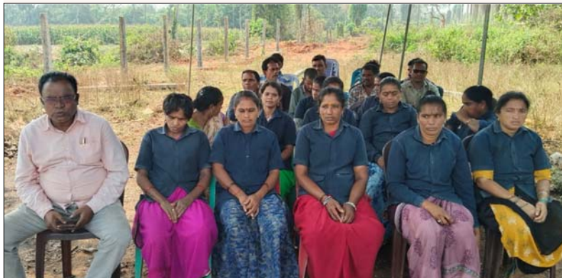
బీపురుపల్లి మార్చి 8: మేజర్ స్వస్తి: