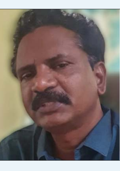
రాచికమతం మార్చి 8: మేజర్ స్వస్తి:

మండలంలో కొత్తకోట సబ్ స్టేషన్ పరిధిలో ఆదివారం విద్యుత్ సరఫరా నిలిపిస్తున్నామని మండల విద్యుత్ శాఖ అసిస్టెంట్ ఇంజనీర్ నందన్ తెలిపారు. దొండపూడి ఫిడర్ విభజన పనులు కారణంగా ఉదయం 9 నుంచి సాయంత్రం నాలుగు గంటల వరకు విద్యుత్ సరఫరా నిలిపిస్తున్నామని ఆయన తెలిపారు. ఈ కారణంగా టి అర్బాపురం దొండపూడి, కొత్తపట్నం గంపవానిపాలెం జె. నాయుడు పాలెం తదితర గ్రామాల్లో విద్యుత్ సరఫరా ఉండదన్నారు ఈ అసోకర్యానికీ వినియోగదారులు సహకరించాలని ఆయన కోరారు.